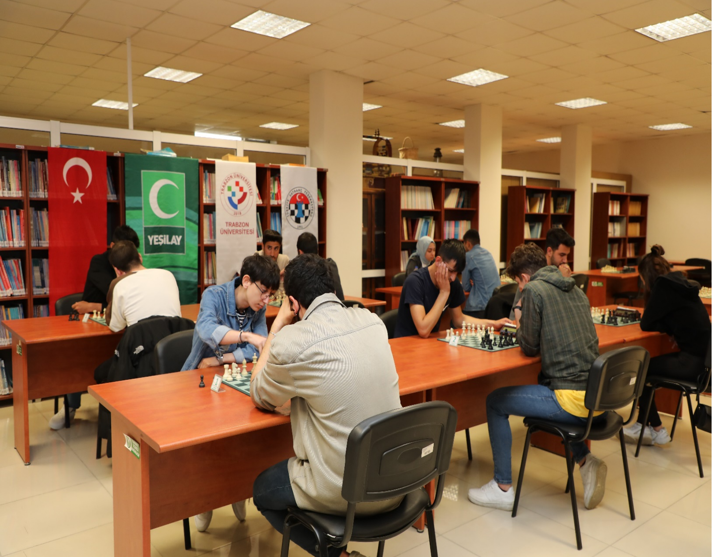
Resim 13 : Üniversitemizde Düzenlenen Satranç Turnuvasından Bir Görünüm