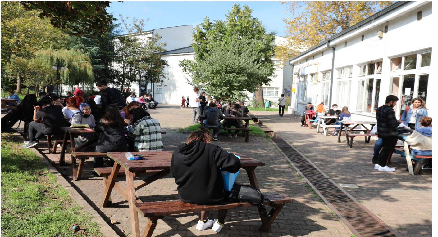
Resim 8: Öğrenci Kantini 2