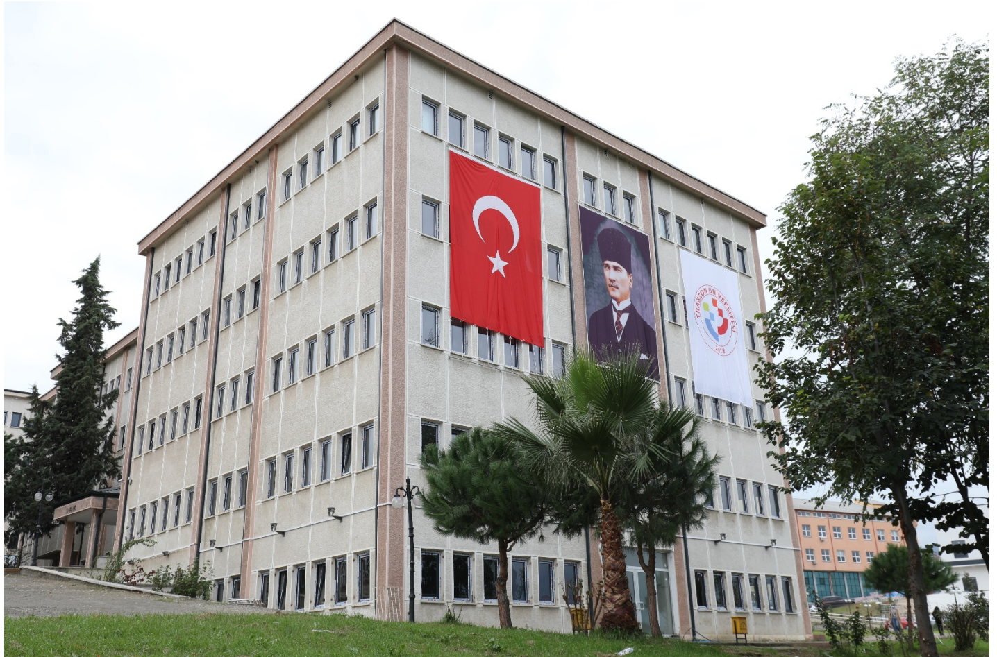
Resim 3. Kampüs İçi Bir Bölüm