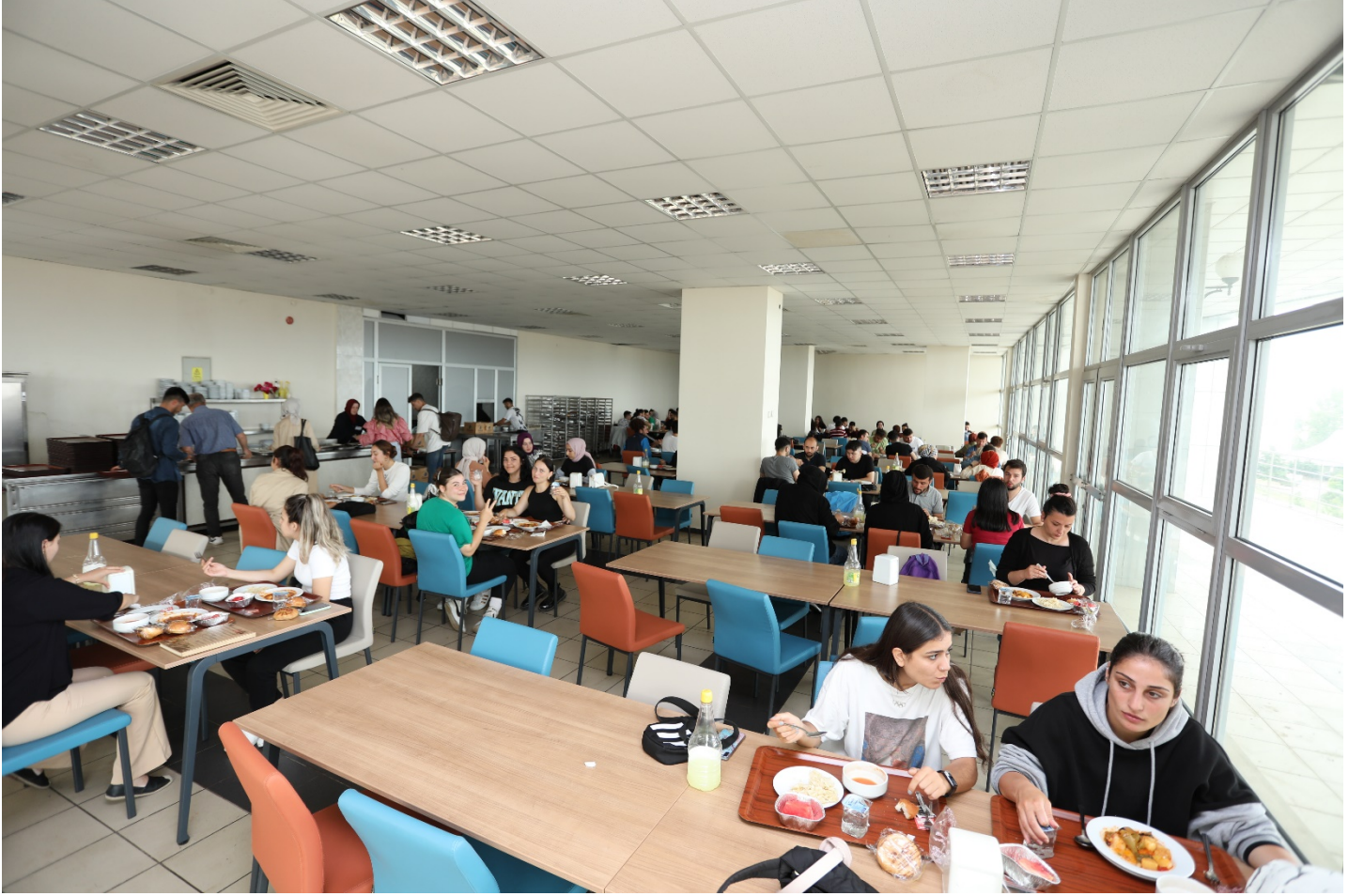
Resim 4: Trabzon Üniversitesi Yemekhanesi