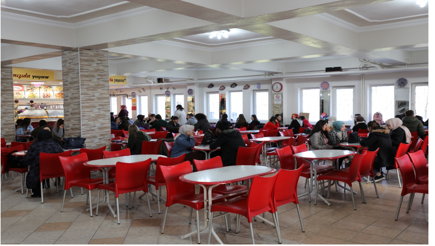
Resim 7: Öğrenci Kantini 1