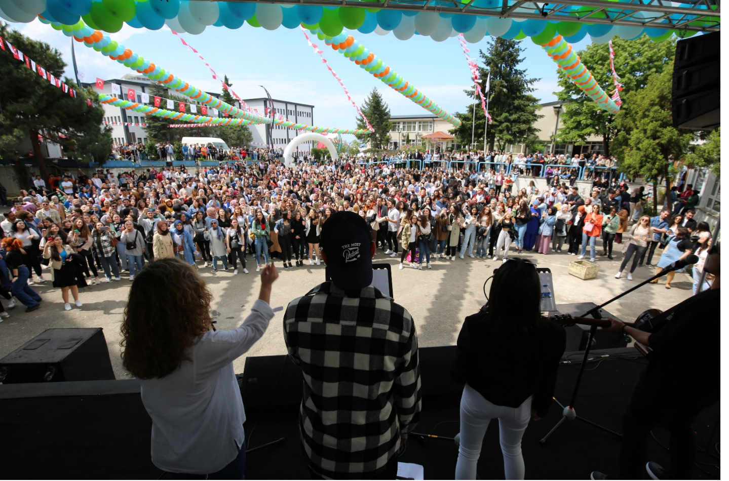
Resim 10: Bahar Şenlikleri Etkinliği