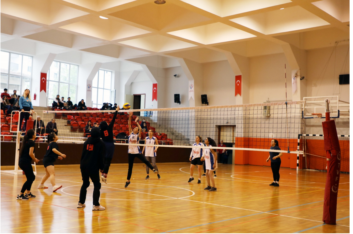
Resim 6: Trabzon Üniversitesi Kapalı Spor Salonu