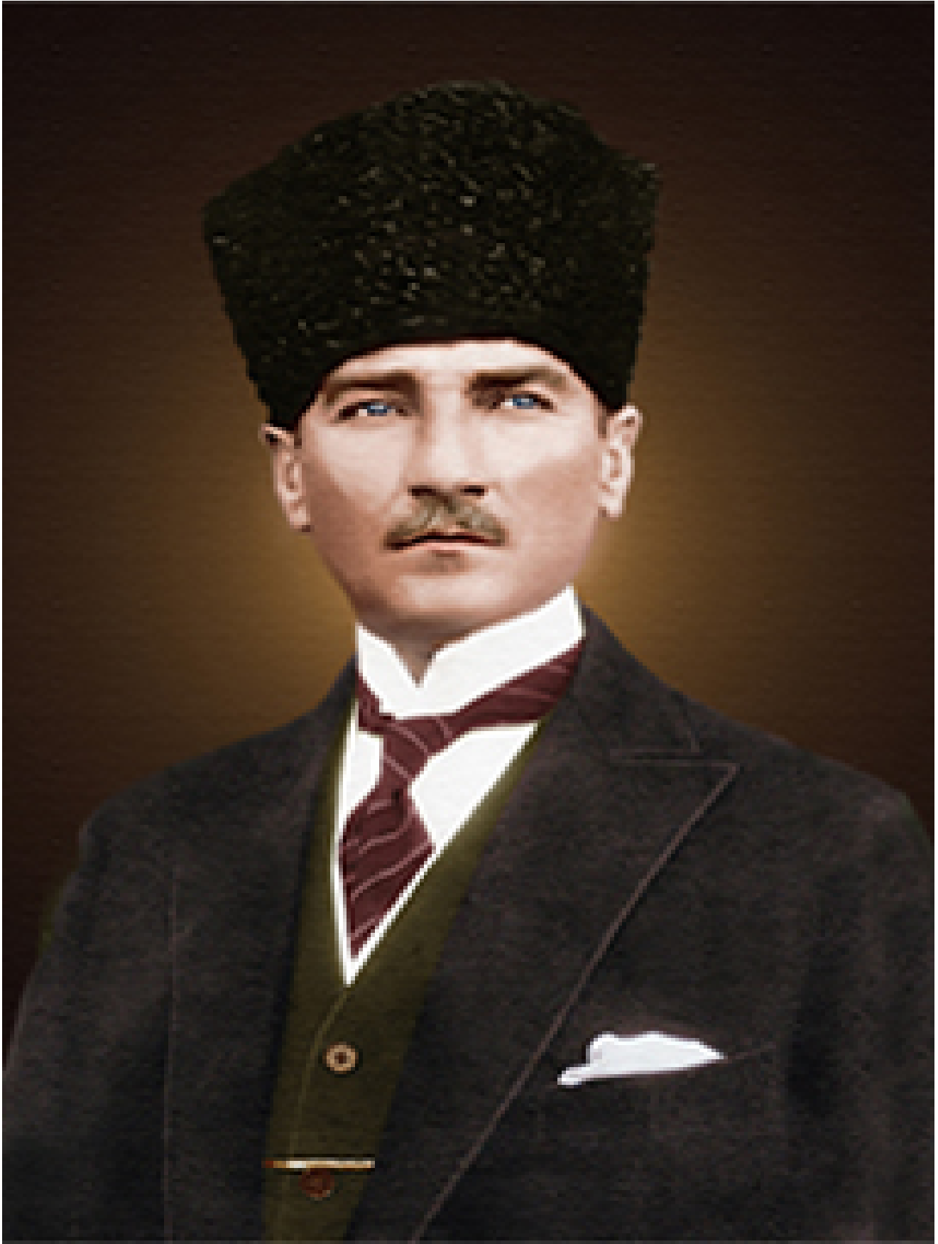
MUSTAFA KEMAL ATATÜRK 1881-1938