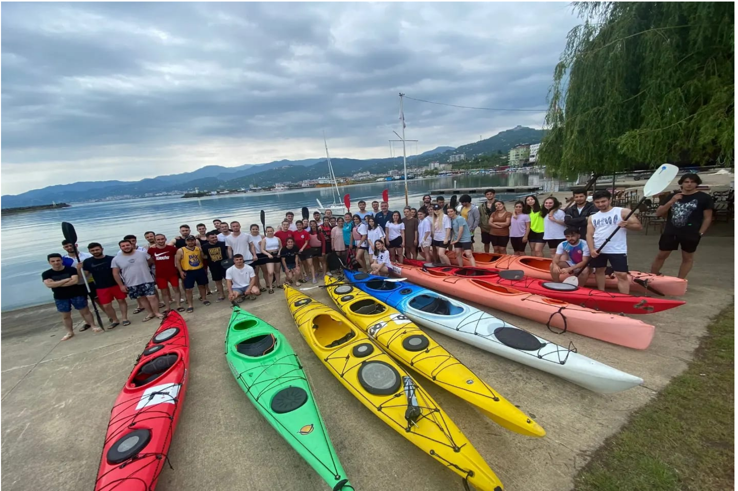
Resim 11: Kano Yarışlarında bir Görünüm