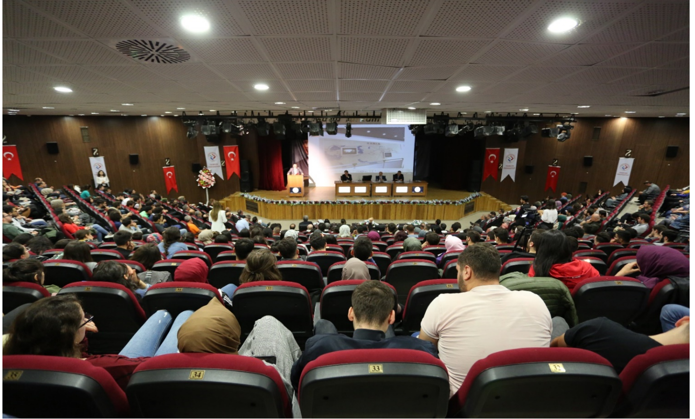
Resim 5- Trabzon Üniversitesi Toplantı Salonu