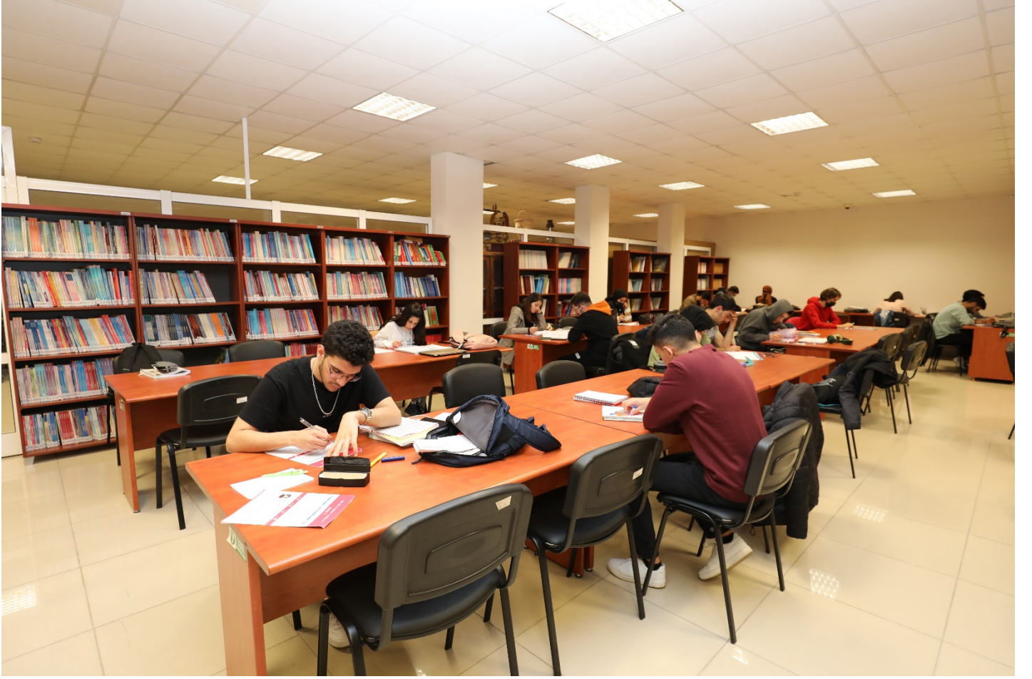
Resim 9 : Trabzon Üniversitesi Kütüphanesinden Bir Bölüm.