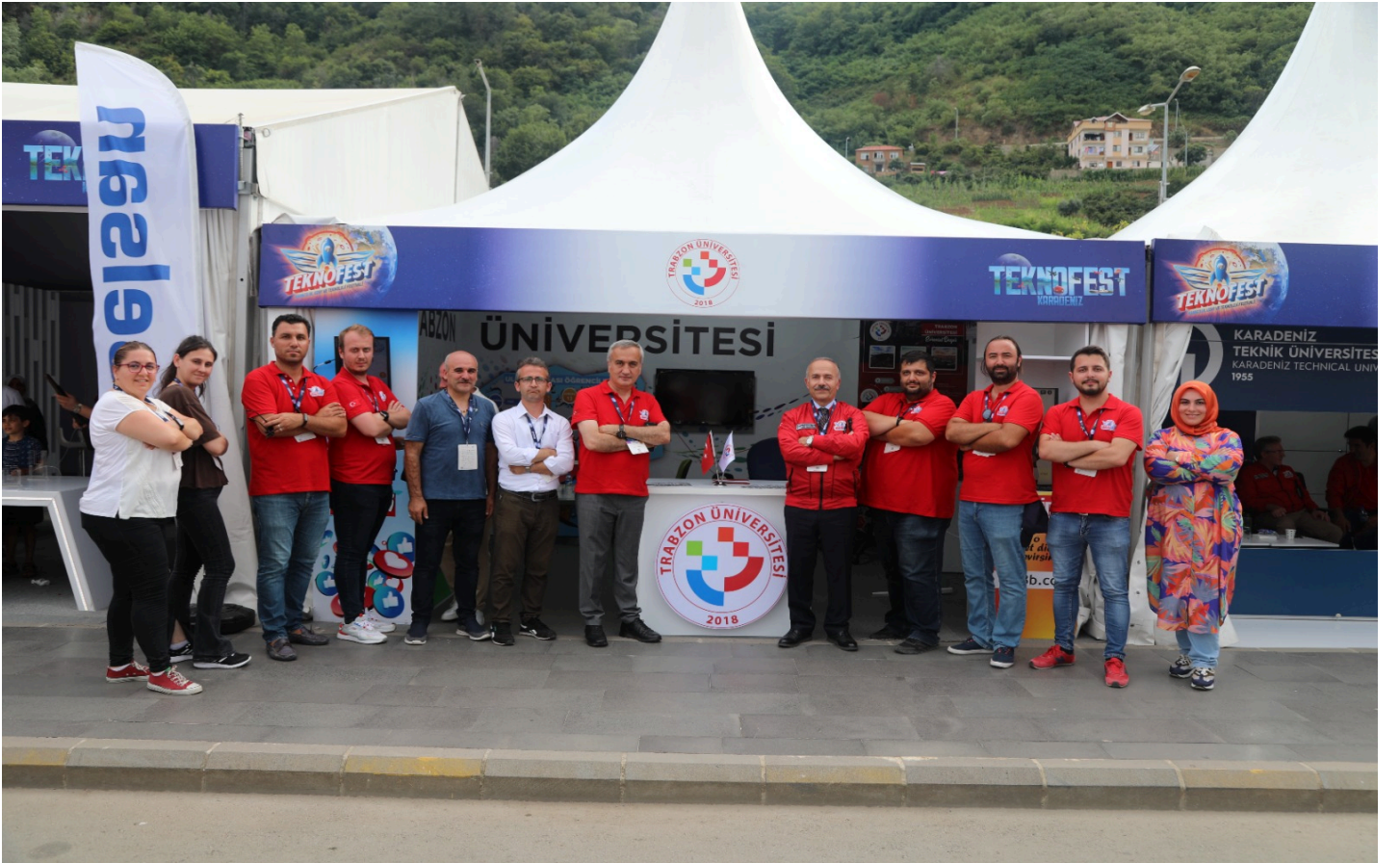
Resim 14: Üniversitemiz Teknofes'te

Üniversitemize Teknofest’de İki Ödül kazandı.