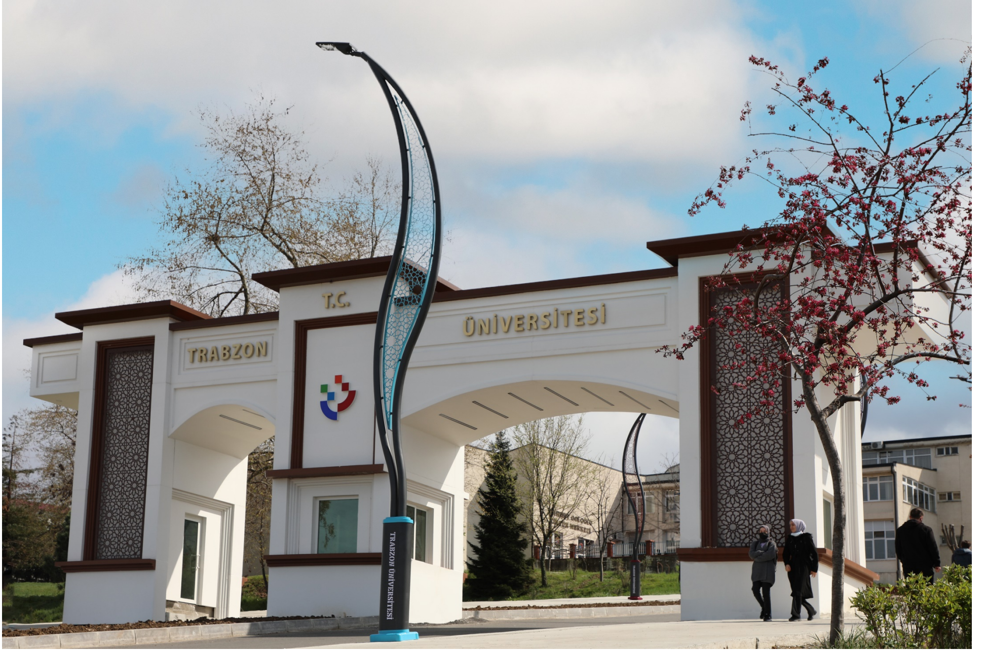
Resim 1 : Trabzon Üniversitesi Girişi