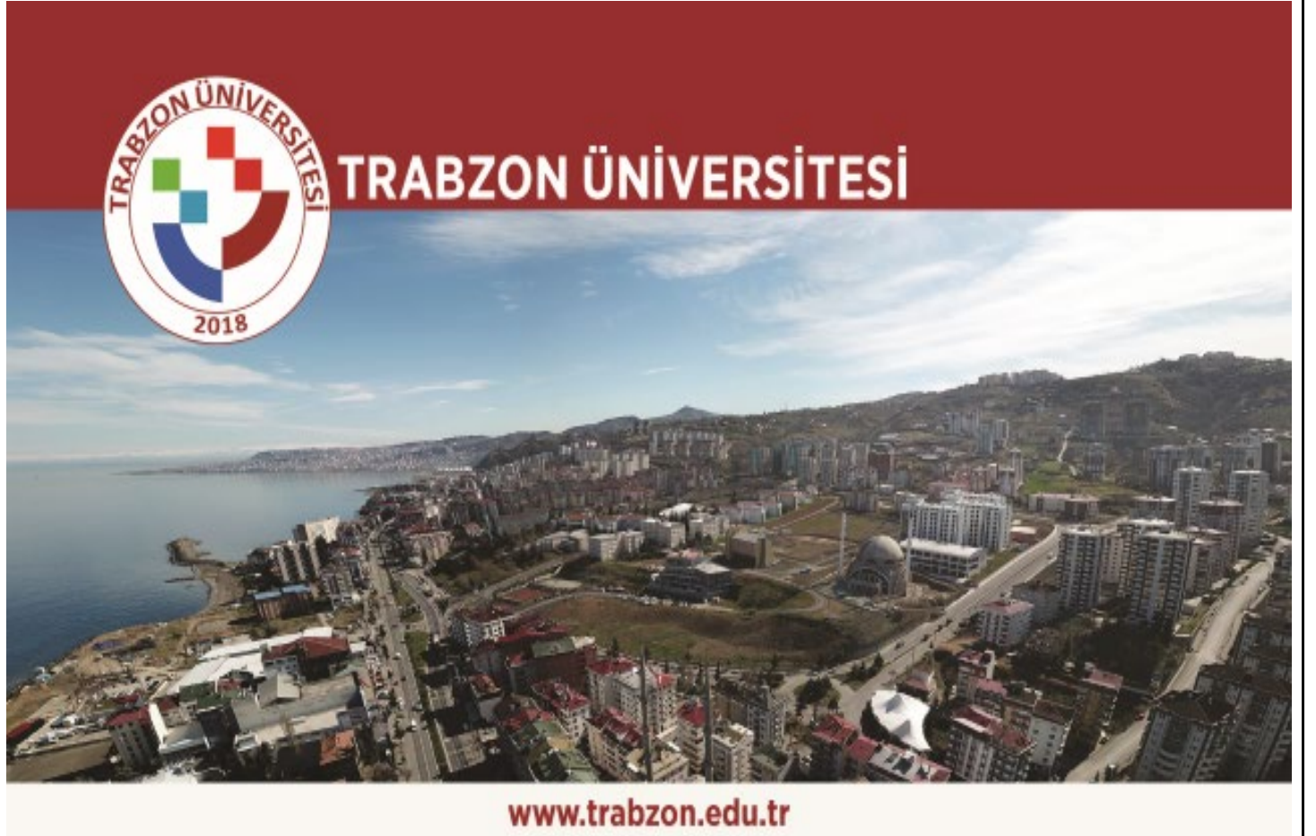
Resim 2. Fatih Yerleşkesi