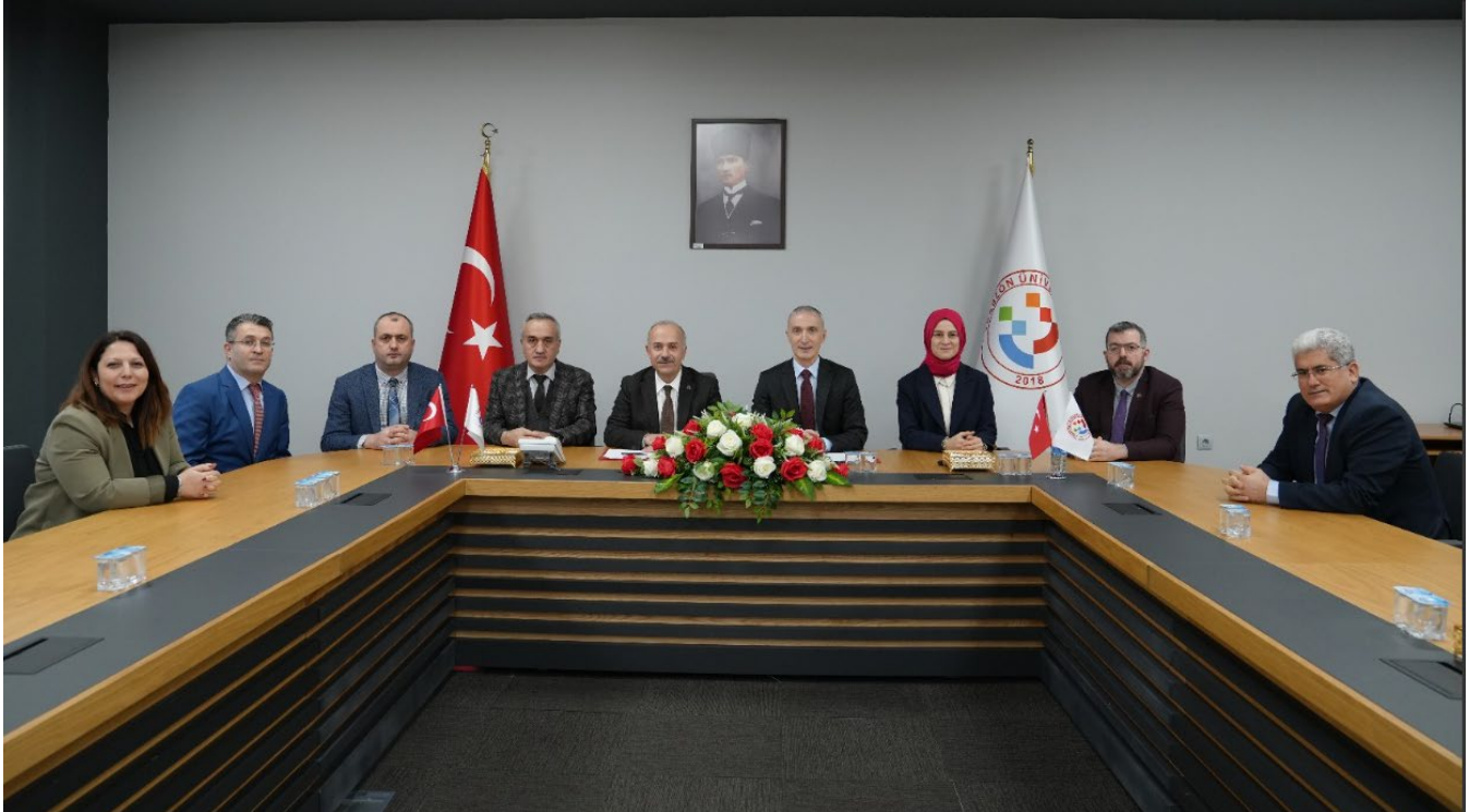
Resim 16 - Trabzon Cumhuriyet Başsavcılığı ile Denetimli Serbestlik Protokolü