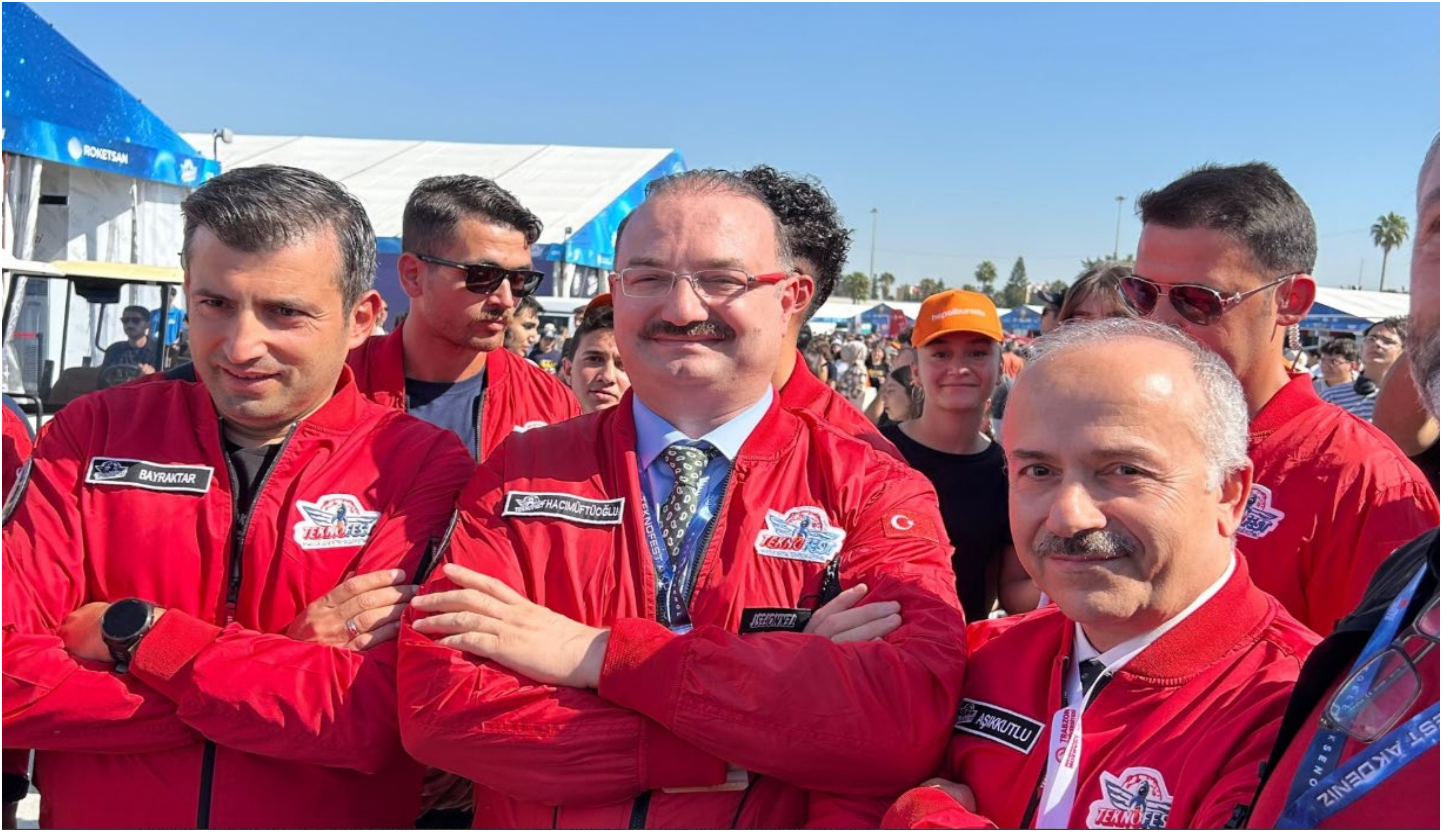
Resim 18: Üniversitemiz Teknofes'te