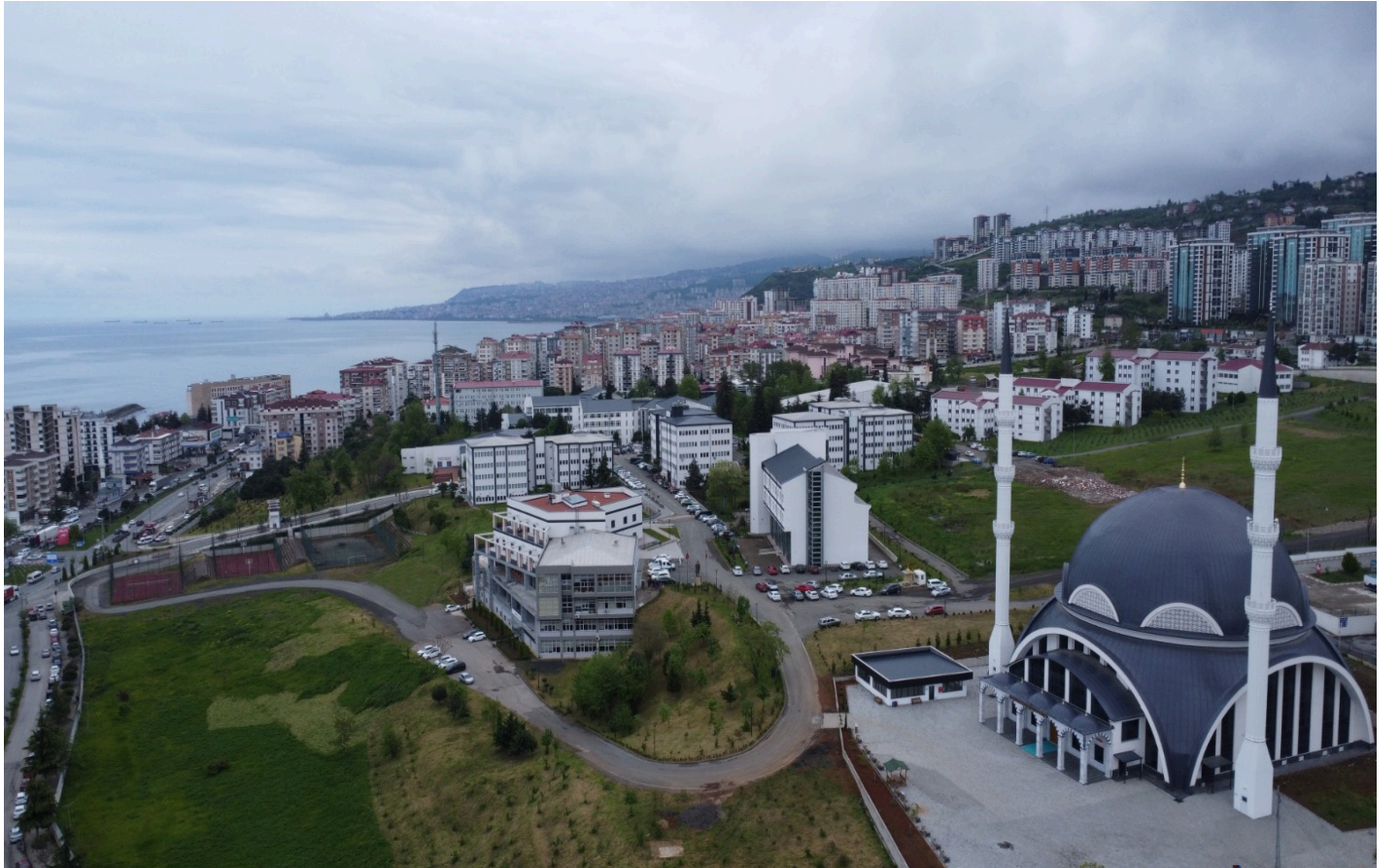
Resim 3. Kampüse Bakış