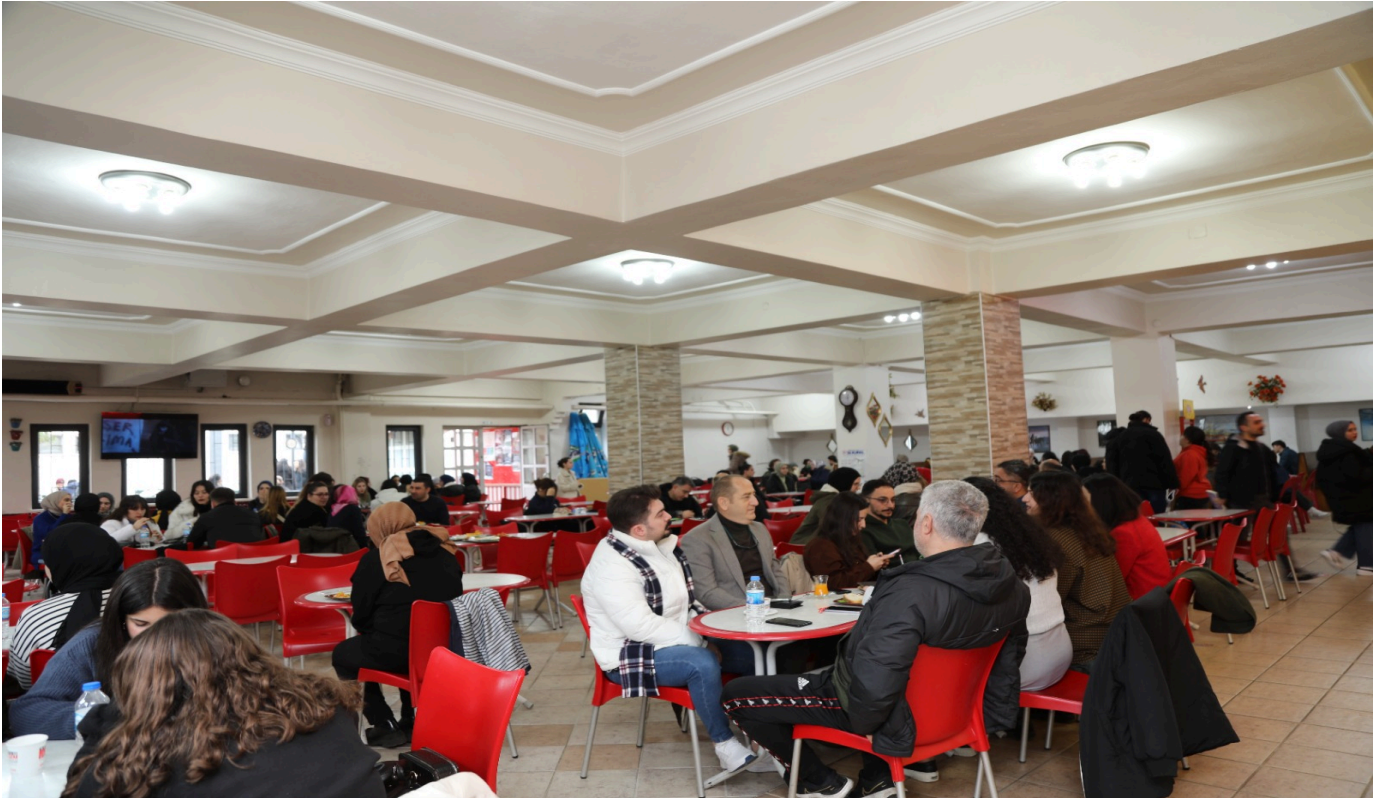
Resim 8: Öğrenci Kantini 2 (Kırmızı)