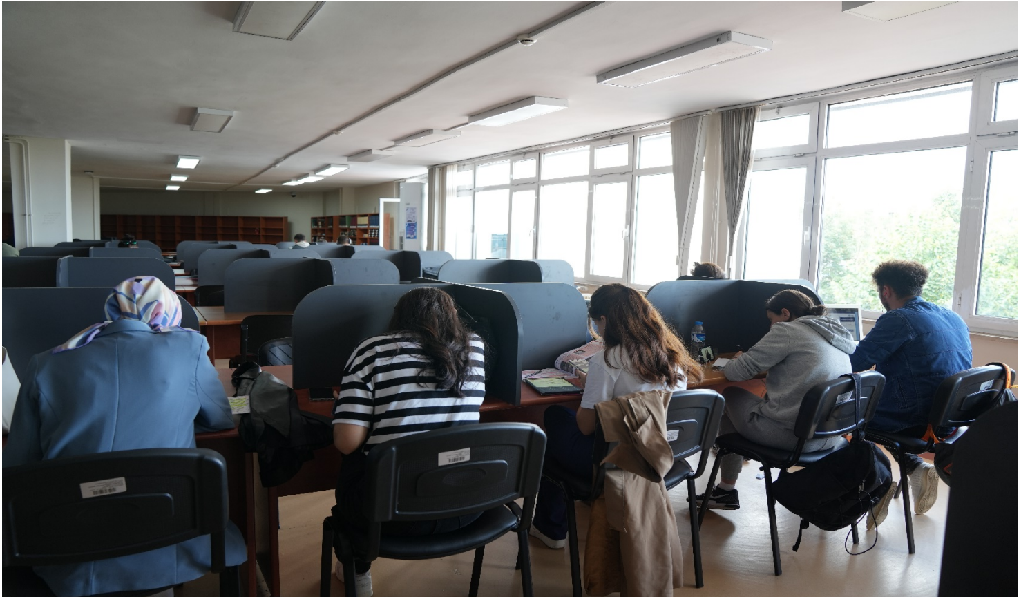
Resim 9 : Trabzon Üniversitesi Kütüphanesinden Bir Bölüm.