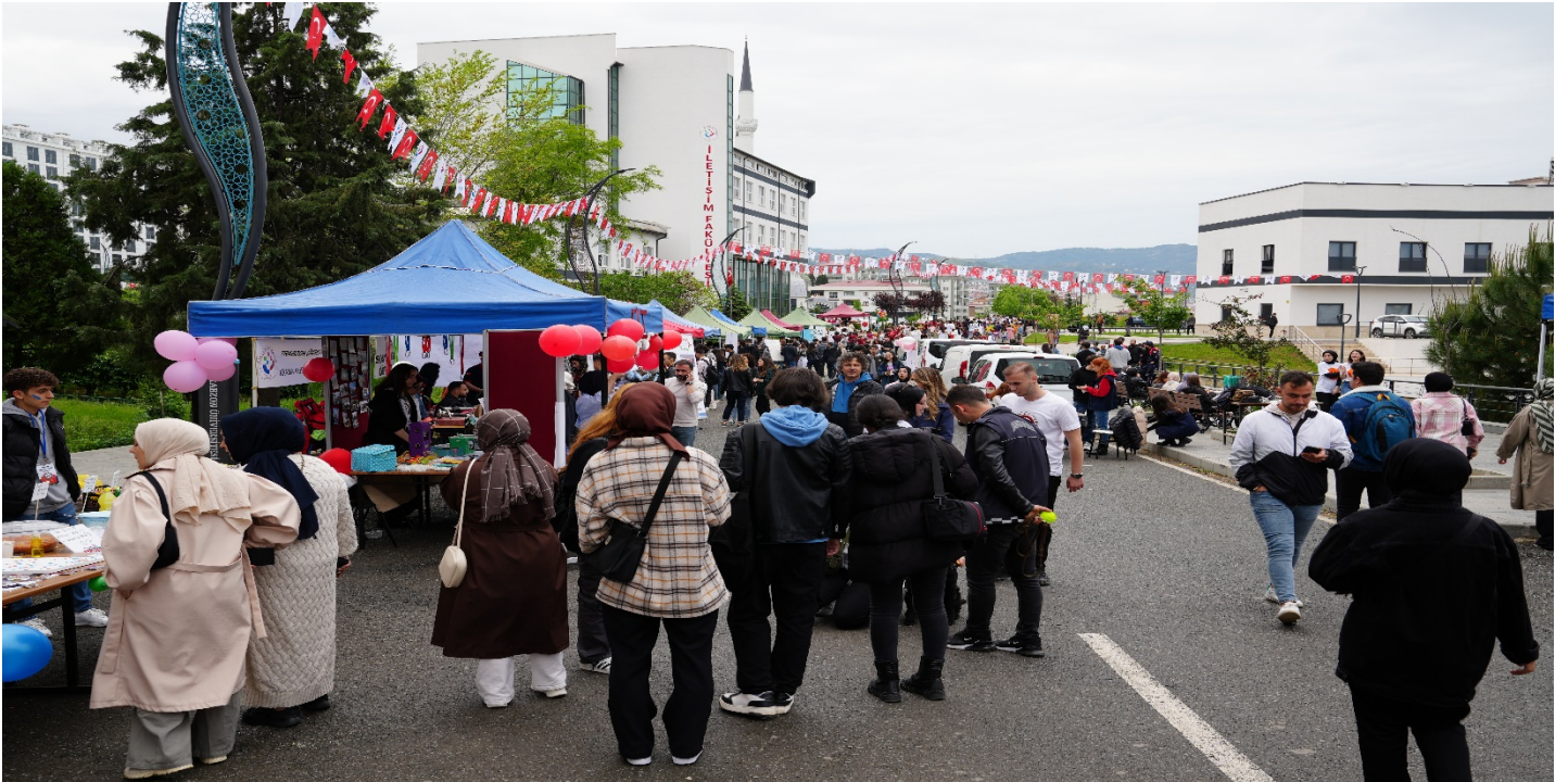
Resim 10: Bilim, Kültür, Sanat ve Spor Etkinliklerimizde Türkiye Mozaïği