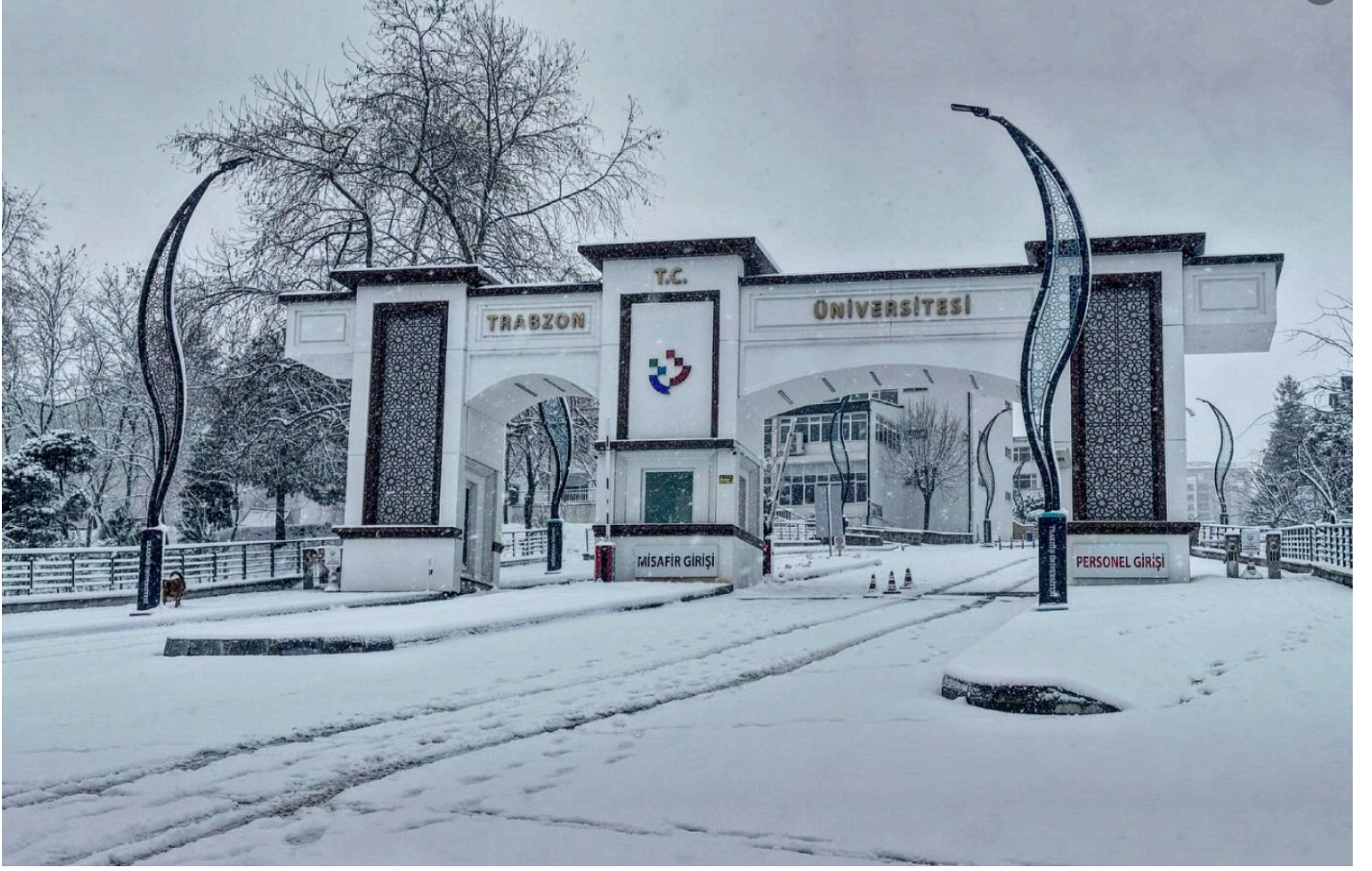
Resim 1: Trabzon Üniversitesi Merkez Yerleşke Girişi (A Kapısı)