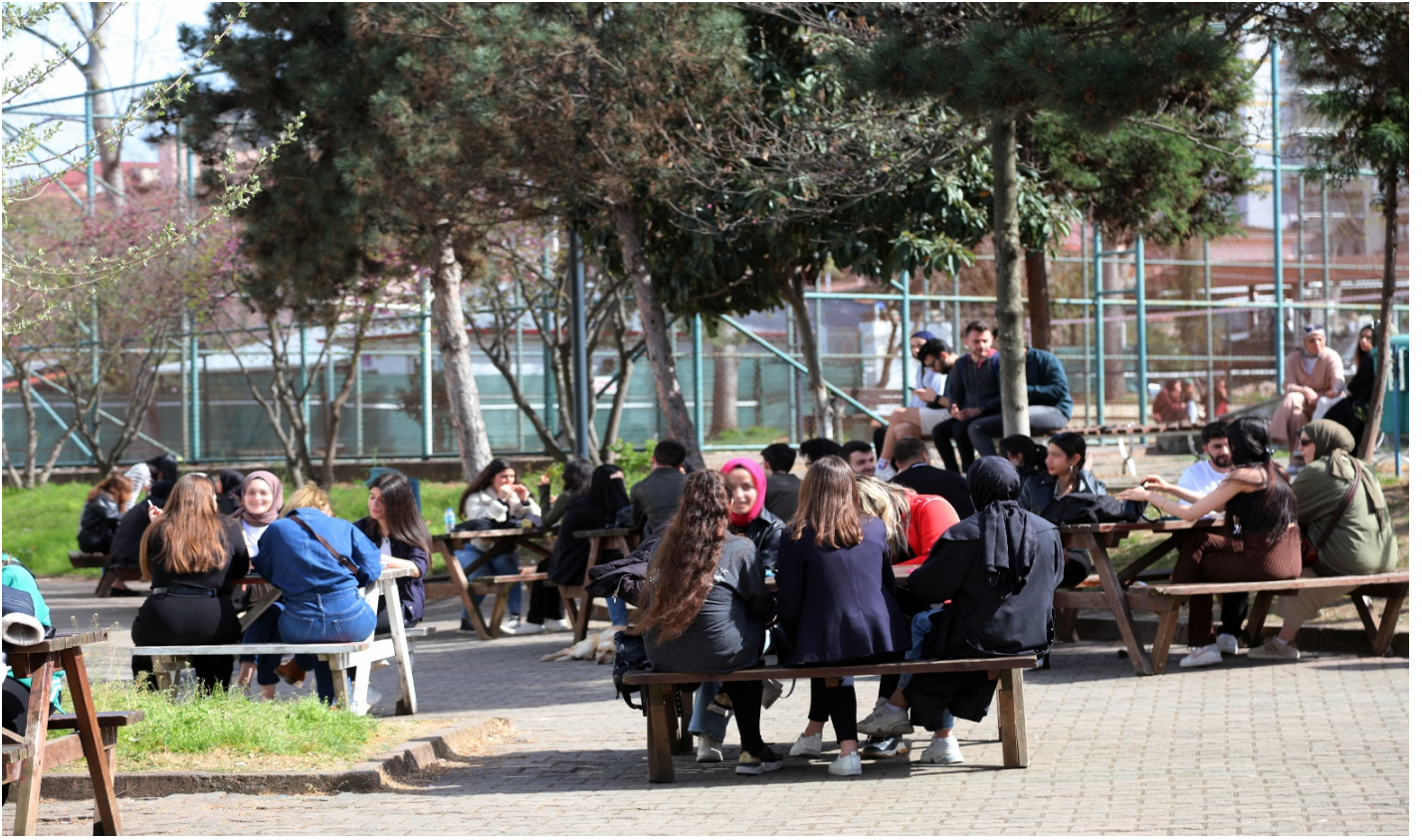
Resim 7: Öğrenci Kantini Önü 1 (Obam)