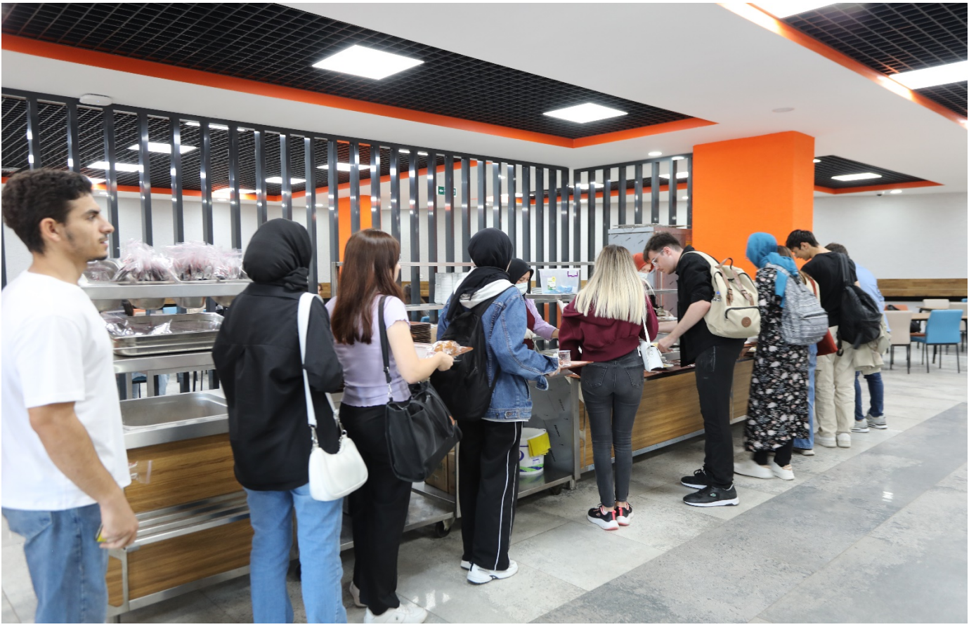
Resim 4: Trabzon Üniversitesi Yemekhanesi