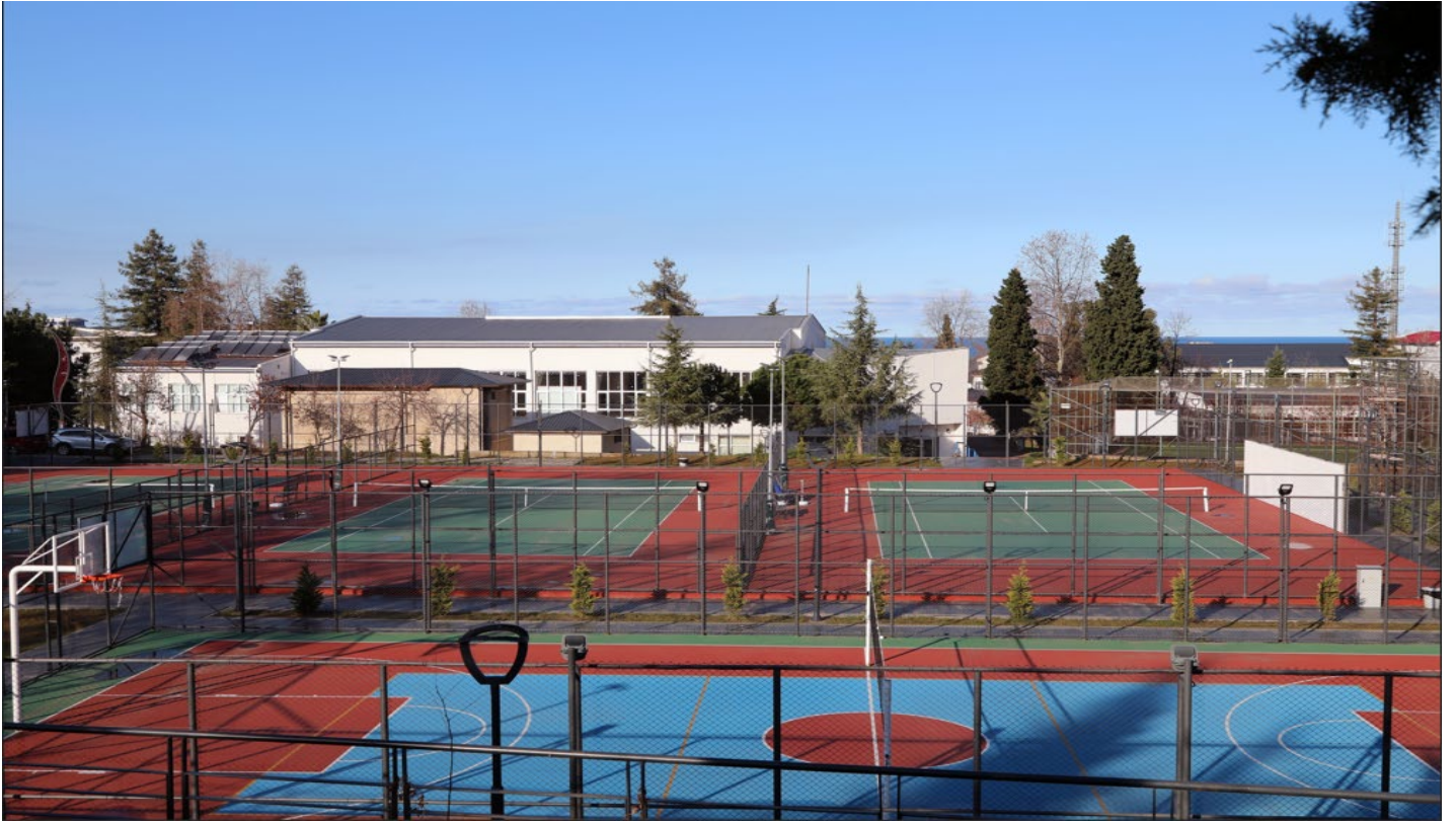
Resim 6: Trabzon Üniversitesi Spor Sahaları