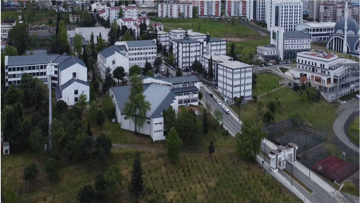
Resim 2. Fatih Yerleşkesi