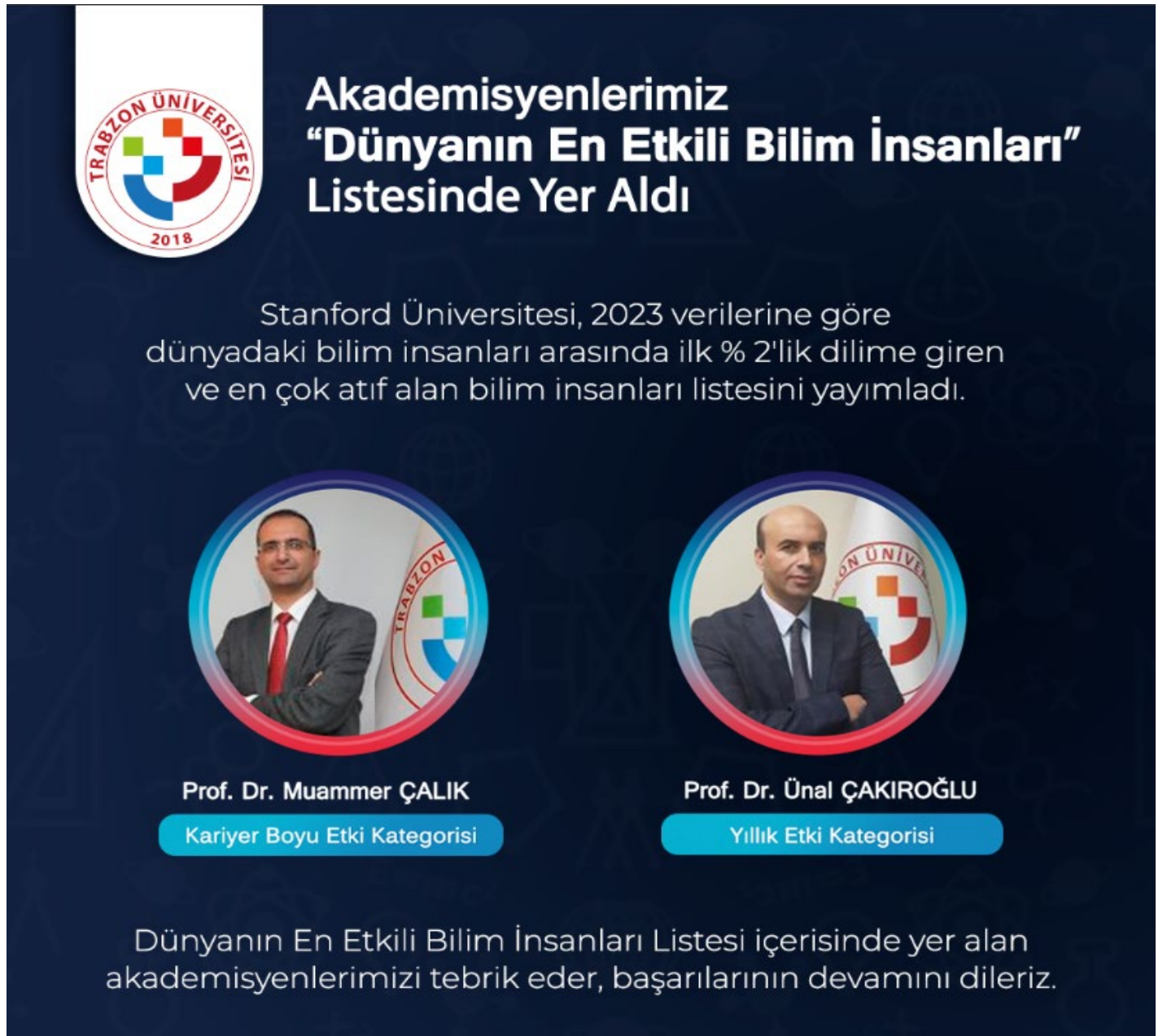
Resim 17. Akademisyenlerimiz “Dünyanın En Etkili Bilim İnsanları” Listesinde