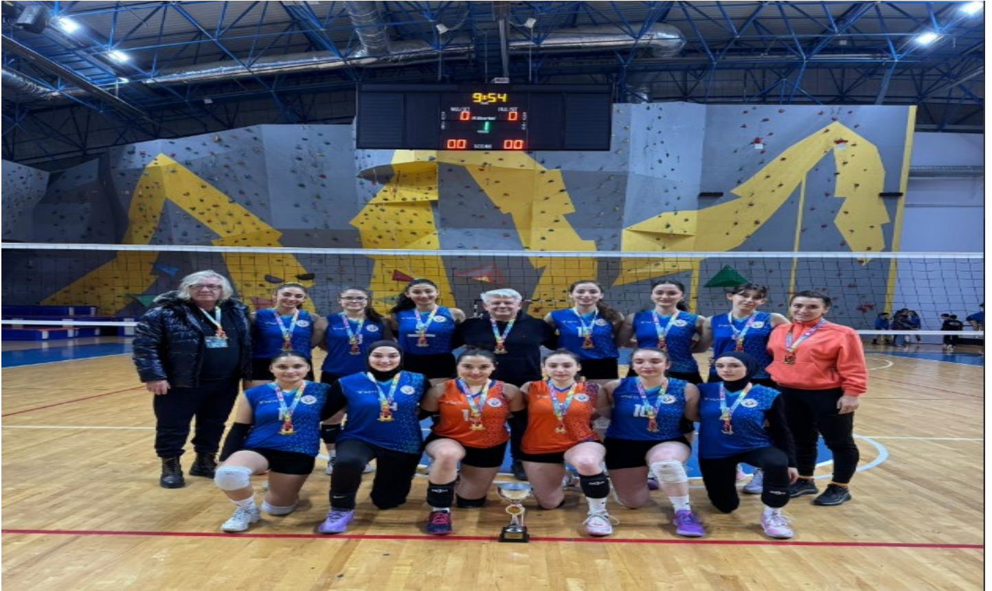
Resim 11: Ünilig Bölgesel Lig Voleybol Müsabakalarında Altın Madalyamızı Aldık

Trabzon Üniversitesi kadın voleybol takımımız Artvin’de yapılan üniversiteler arası bölgesel lig maçlarını set vermeden birinci olarak tamamlamıştır. Tüm takım oyuncularına ve hocalarımıza teşekkür ediyoruz.