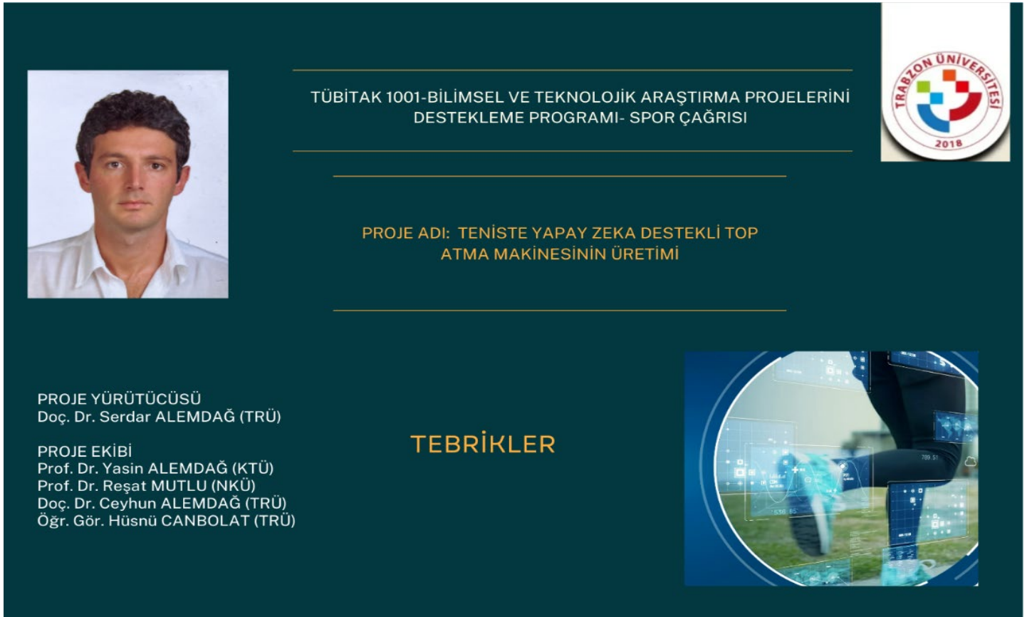
Resim 14 : "Teniste Yapay Zeka Destekli Top Atma Makinesinin Üretimi" adlı projemiz destek aldı.

Bulgaristan, Sofya'da 12-21 Ekim tarihleri arasında gerçekleştirilen Boks U23 Avrupa Şampiyonasında, Üniversitemiz Antrenörlük Bölümü üçüncü sınıf öğrencimiz 'Gamze Soğuksu' 52 kilogramda Avrupa ikincisi olmuştur. Antrenörlük Bölümü dördüncü sınıf öğrencimiz 'Aleyna Demirkır' 50 kilogramda Avrupa üçüncüsü olmuştur. Beden Eğitimi ve Spor Öğretmenliği Bölümü dördüncü sınıf öğrencimiz 'Mehmethan Çınar' 57 kilogramda Avrupa üçüncüsü olmuştur. Ülkemizi ve Üniversitemizi en güzel şekilde temsil ettikleri için kendilerine şükranlarımızı iletmekteyiz.