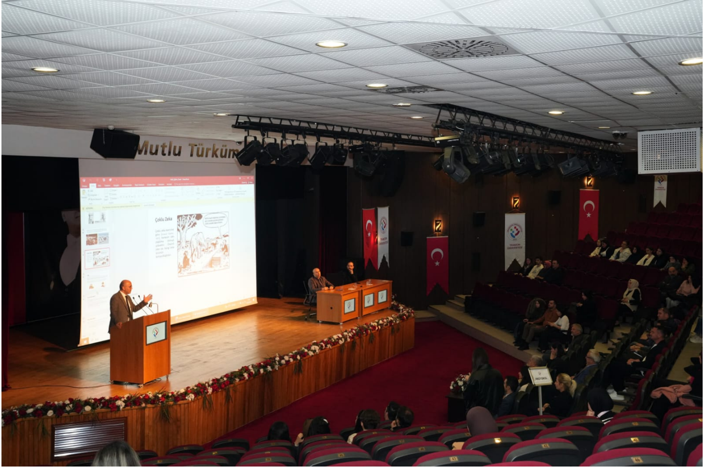
Resim 19 – Üniversitemizde Yapay Zeka ve Toplumsal Dönüşüm Paneli

Üniversitemizde Yapay Zeka ve Toplumsal Dönüşüm konulu panel gerçekleştirildi. Panelde, Nobel ödüllerinin belirlenmesinde bile doğrudan yapay zeka tekniklerini kullananların öne geçtiği vurgulandı.