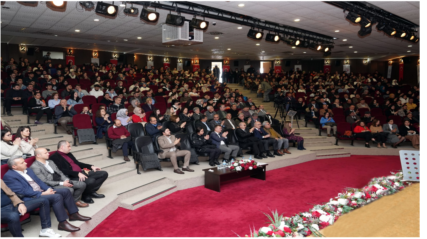
Resim 5- Trabzon Üniversitesi Golođlu Kùltür Merkezi