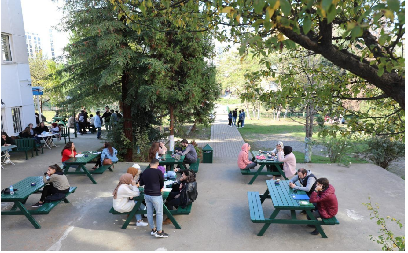
Resim 3. Öğrenci Kantini 1