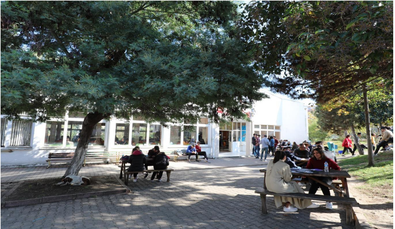
Resim 4. Öğrenci Kantini 2