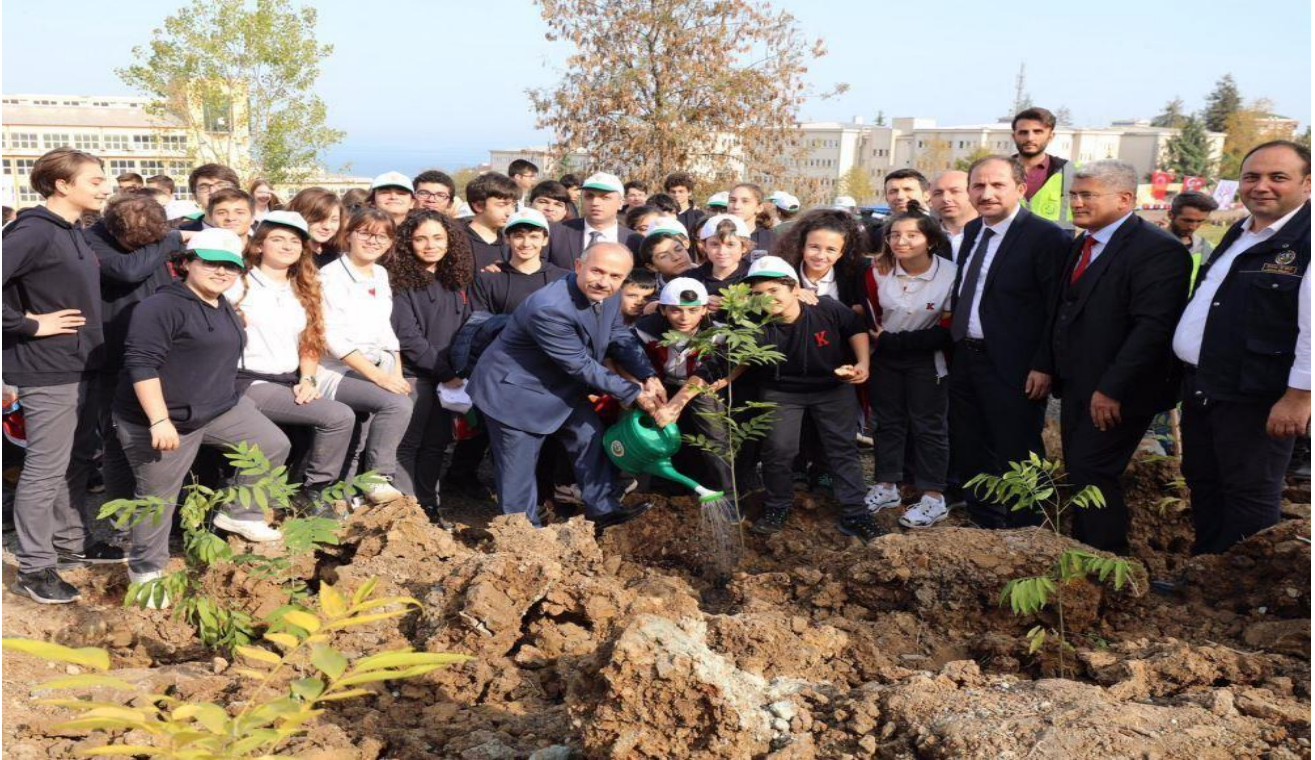
Resim 5. 11.11.2019 ‘ Nefes Ol’ Ağaçlandırma Etkinliđi