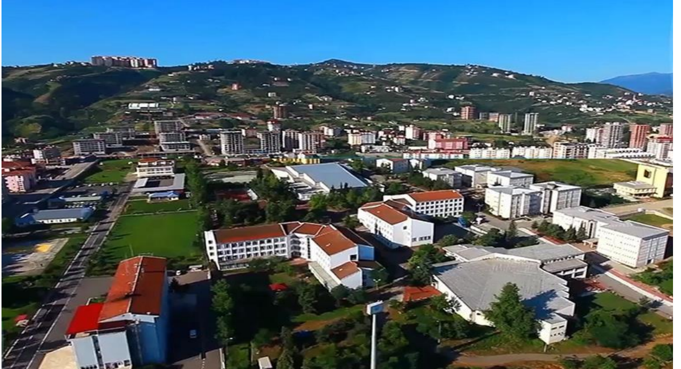
Resim 1. Fatih Yerleşkesi