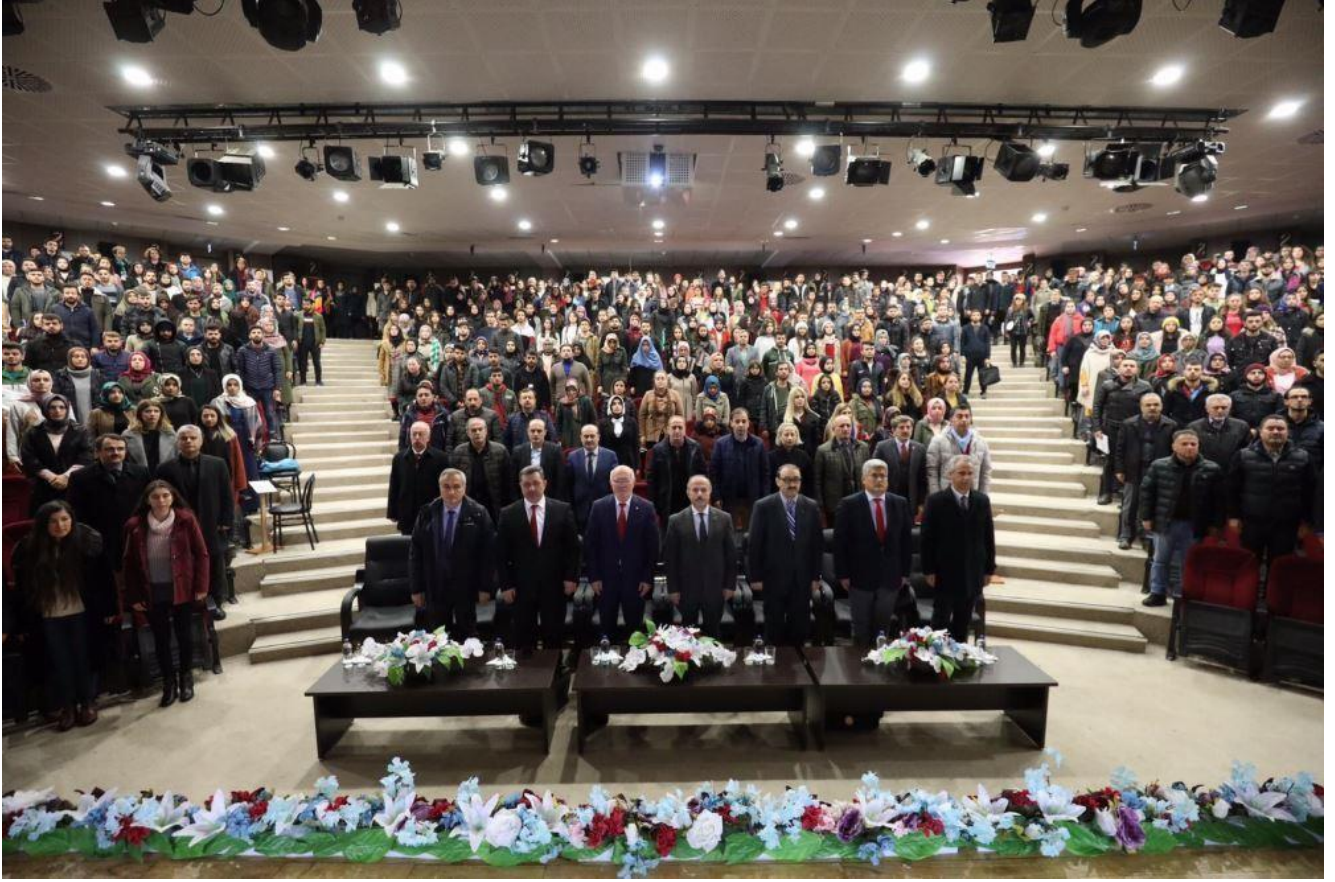
Resim 9. Türk-İslâm Bilim Geleneği ve Prof. Dr. Fuat SEZGİN konulu panel.