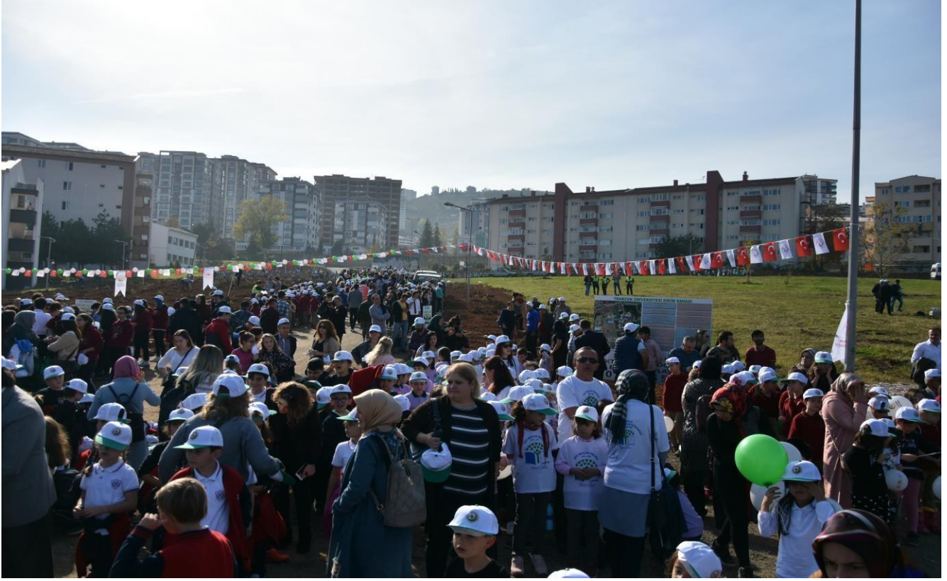
Resim 6. 11.11.2019 ‘ Nefes Ol’ Aaçlandırma Etkinliđi