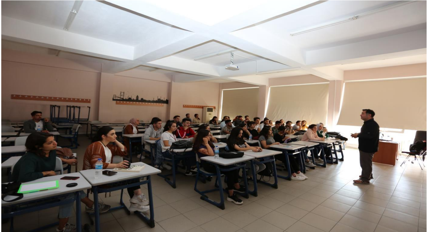
Resim 2. Eğitim Sınıflarımız