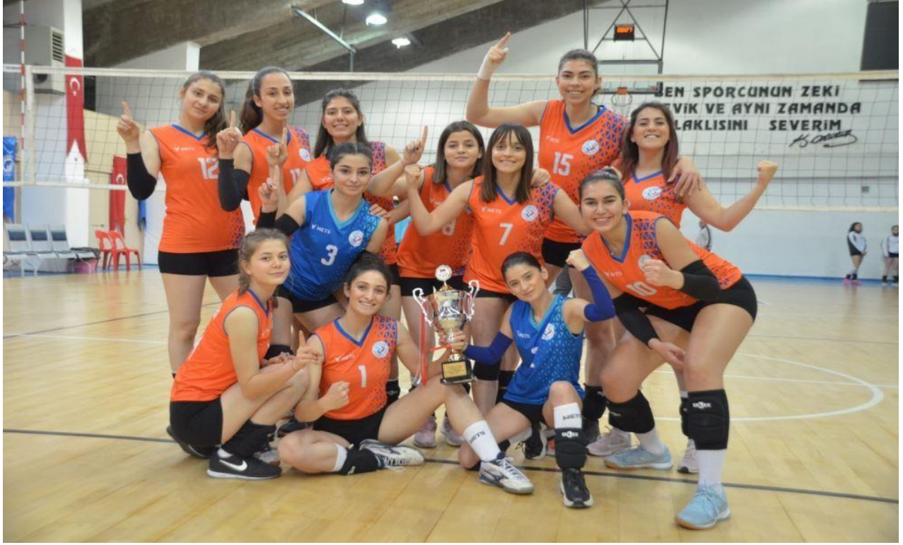
Resim 8. Türkiye Üniversite Sporları 2. Ligi'nde şampiyon olan Kadın Voleybol Takımımız