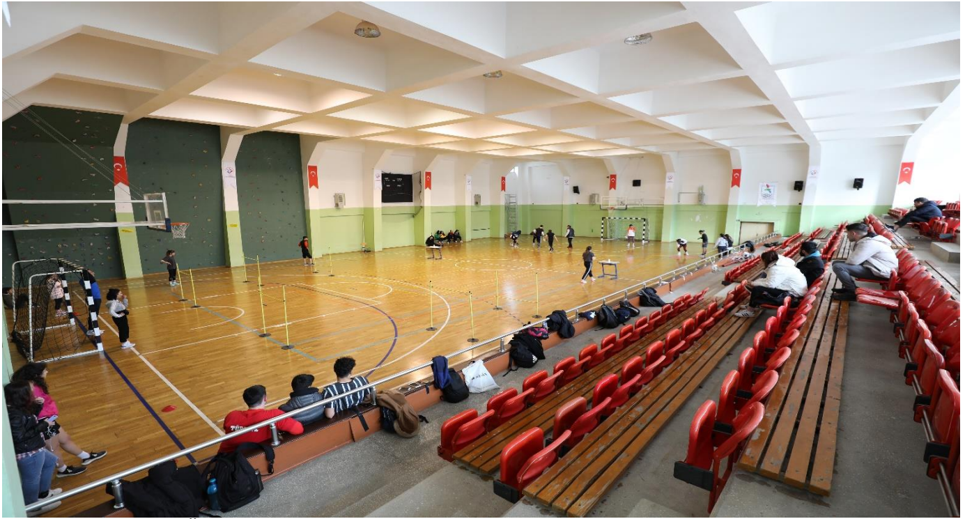
Resim 6: Trabzon Üniversitesi Kapalı Spor Salonu