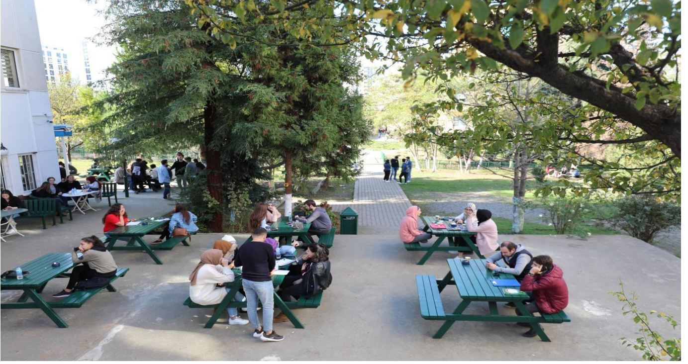
Resim 7: Öğrenci Kantini 1