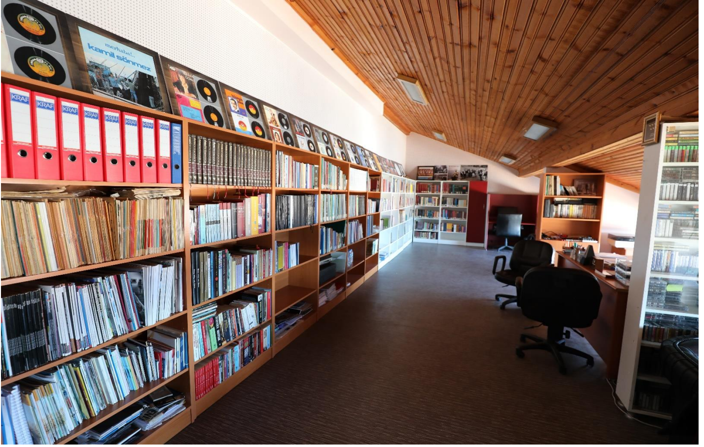
Resim 9 : Trabzon Üniversitesi Kütüphanesinden Bir Bölüm.