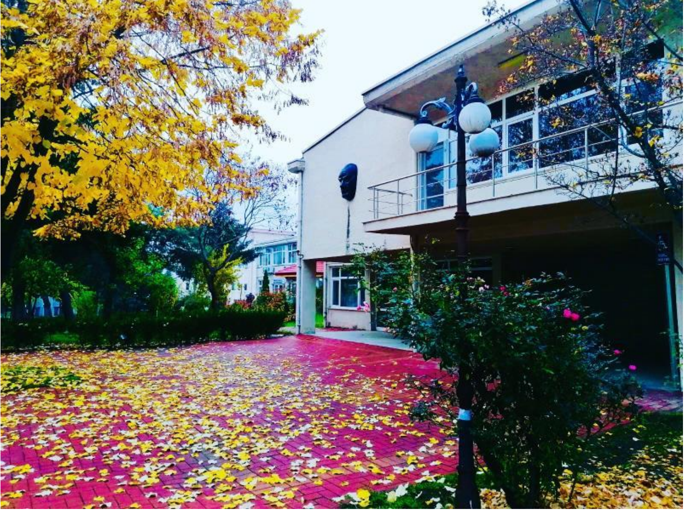
Resim 3. Kampüs İçi Bir Bölüm