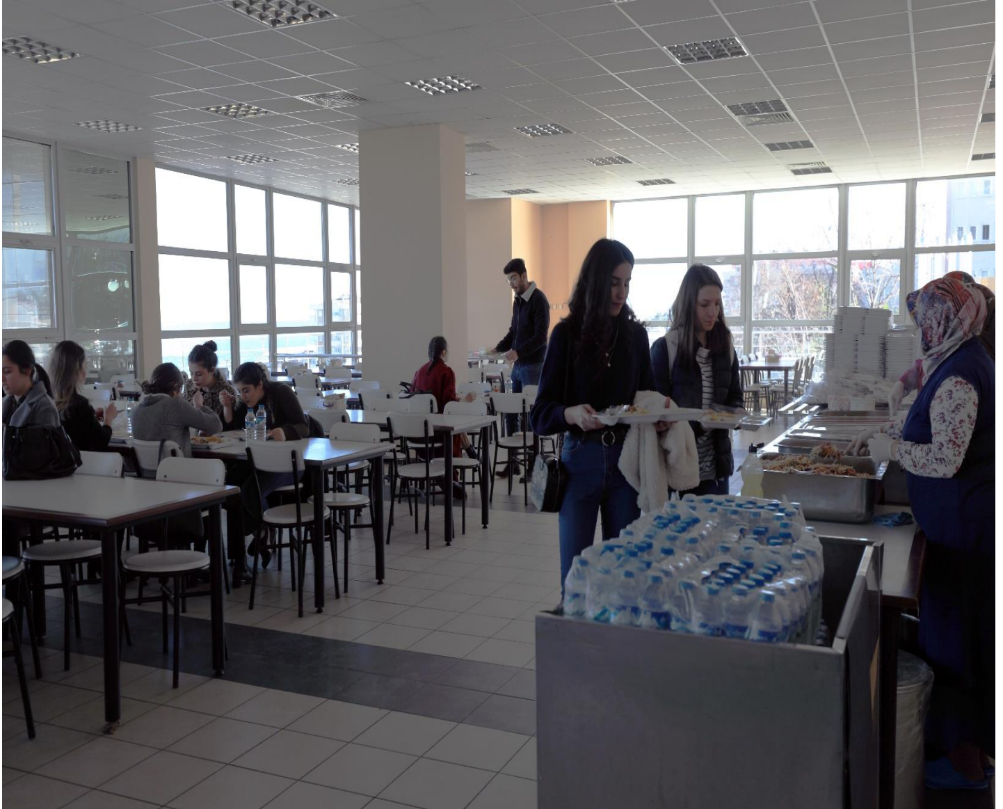
Resim 4: Trabzon Üniversitesi Yemekhanesi