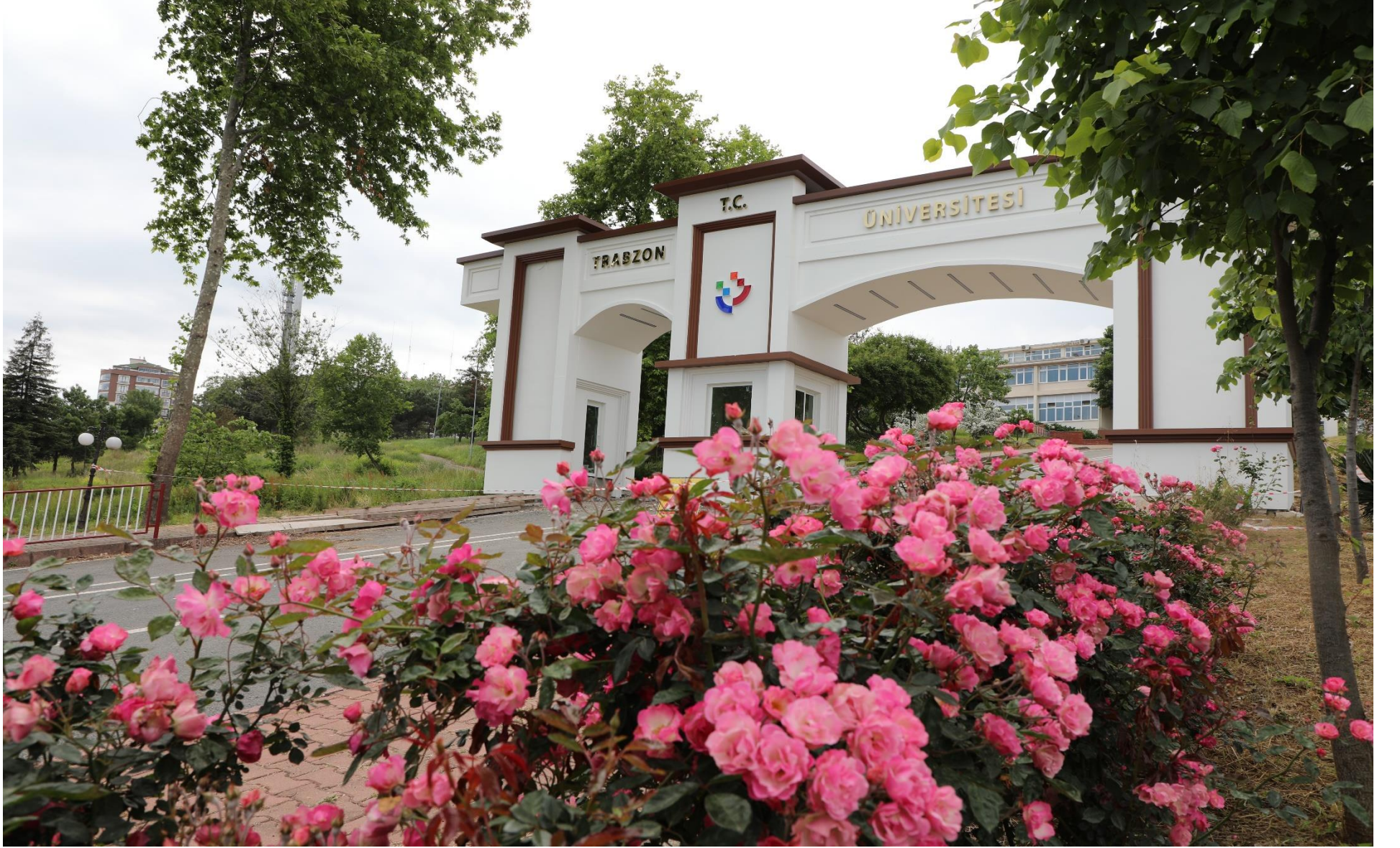
Resim 1 : Trabzon Üniversitesi Girişi