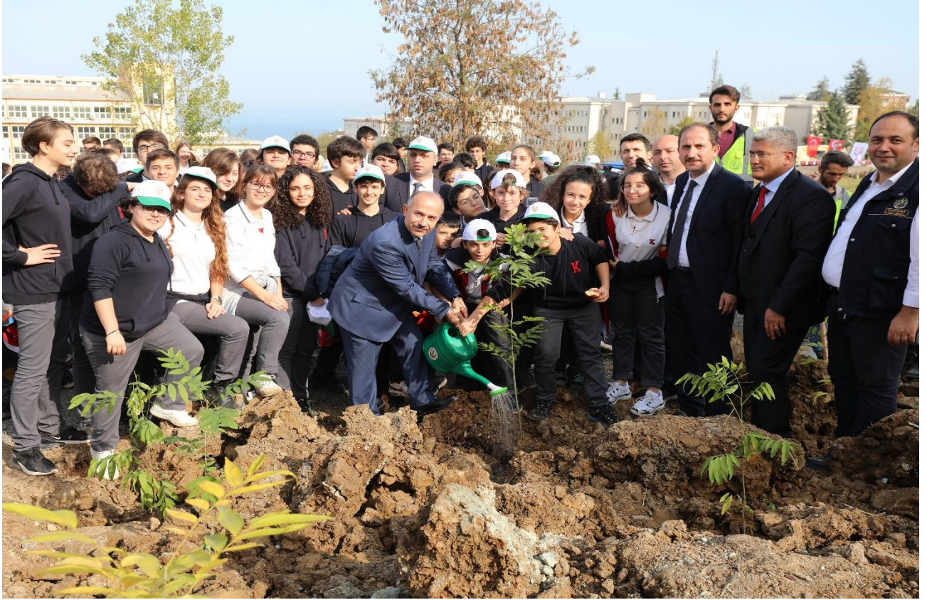
Resim 10: Aaçlandırma Etkinliđi