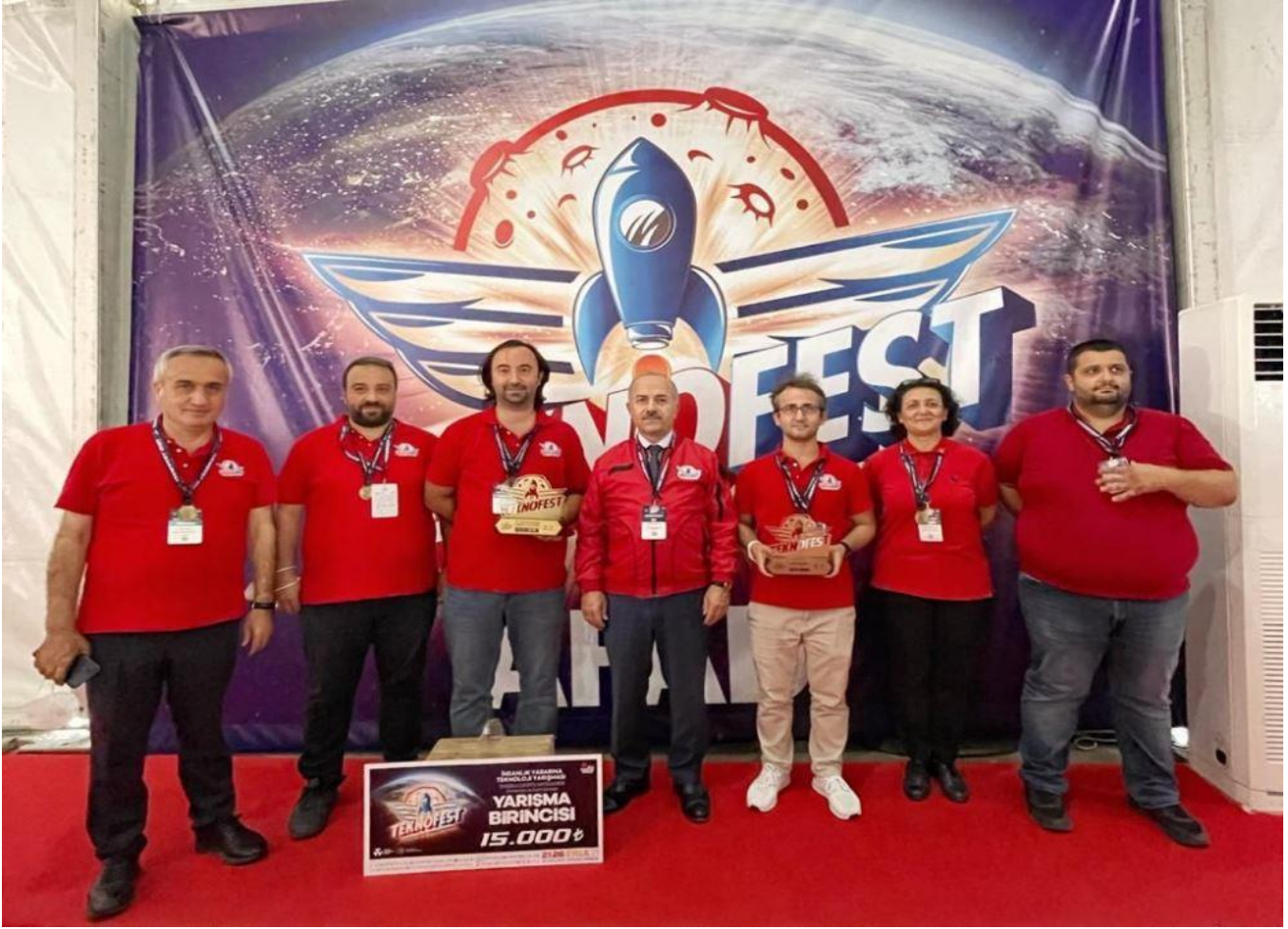
Resim 14: Üniversitemiz Teknofes'te Üniversitemize Teknofest'de İki Ödül kazandı.