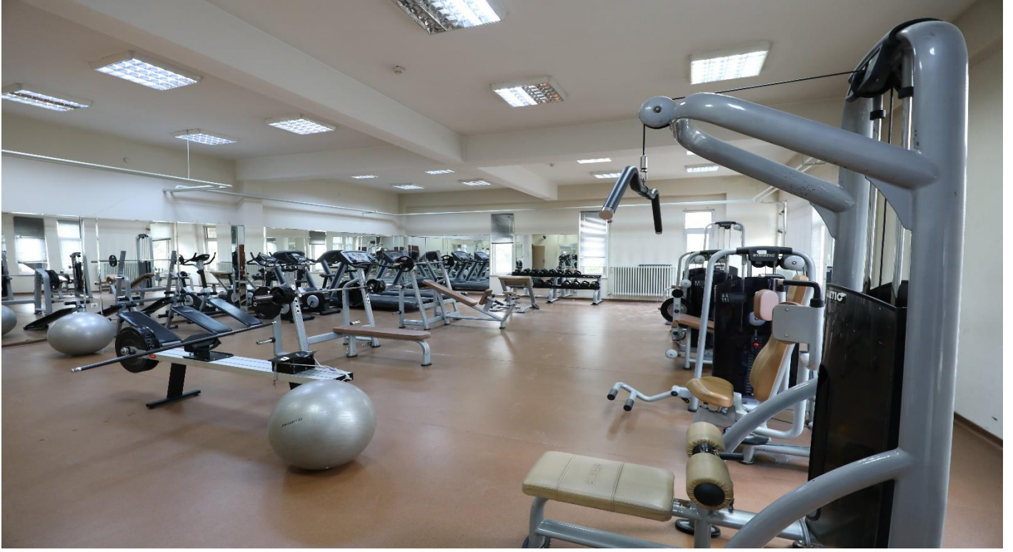
Resim 11: Fitness Salonu