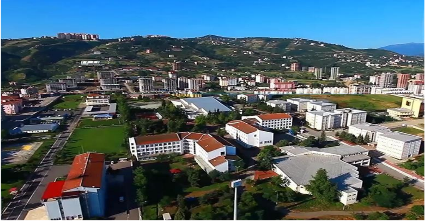
Resim 2. Fatih Yerleşkesi