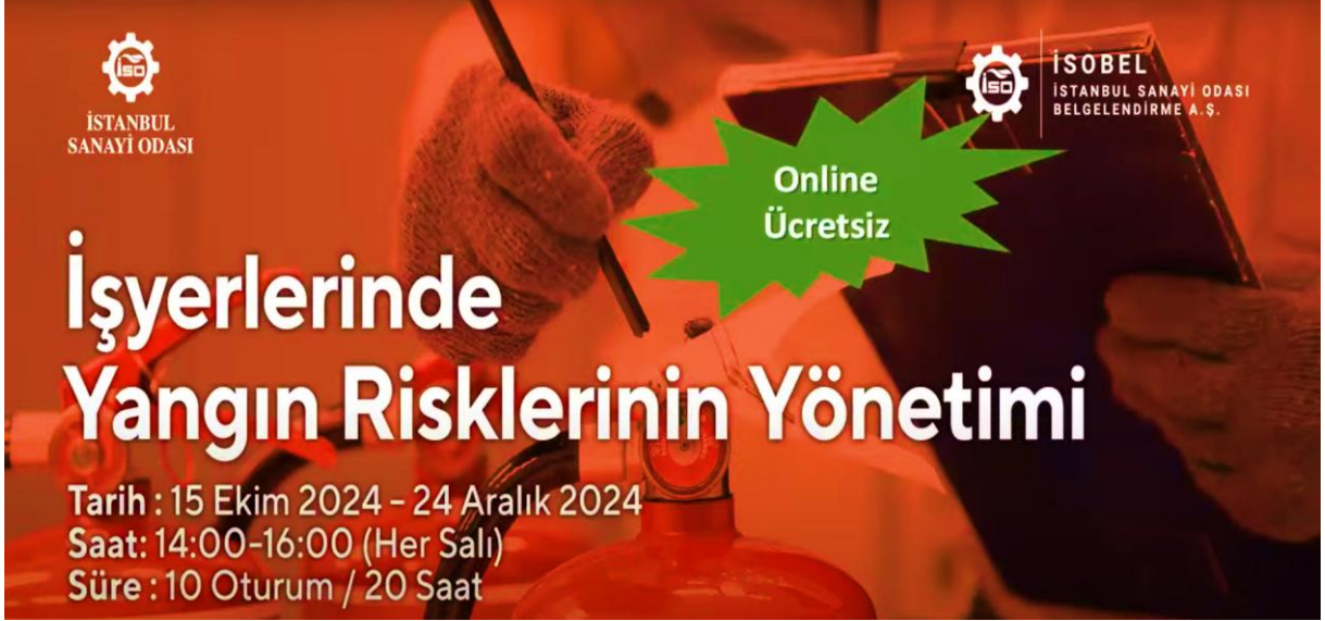
Şekil 6. Üniversitelerde İSG Uygulamaları Çevrimiçi Paneli

İstanbul Sanayi Odasının düzenlediği İşyerlerinde Yangın Risklerinin Yönetimi isimli 12 oturumluk çevrimiçi eğitim serisine katılım sağlanmıştır. İşyerlerinde yangına, patlamaya, yanıcı kimyasallara karşı alınacak önlemler ve ilgili yasal mevzuat hakkındaki görüşler tartışıldı. Etkinlik ile ilgili görsel Şekil 5'te paylaşılmıştır.