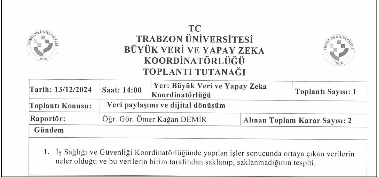
Şekil 2. Toplantı Tutanağı

13.12.2024 tarihinde Büyük Veri ve Yapay Zekâ Koordinatörlüğü ile hem Temel İSG Eğitiminin personel tarafından izlenebileceği hem de arka planda eğitim verilerinin takip edilebileceği bir yazılımın geliştirilmesi üzerine toplantı yapıldı.