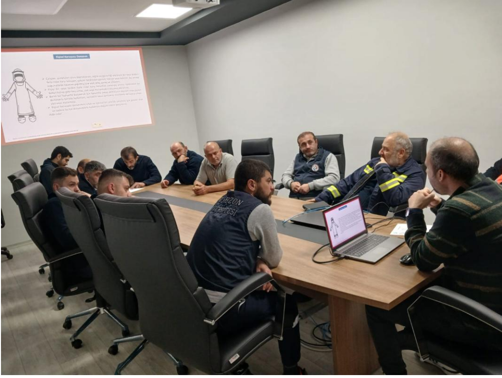
Şekil 10. Kişisel Koruyucu Donanım Eğitimi

Üniversitemizde Kişisel Koruyucu Donanım dağıtımı yapılan Yapı İşleri Daire Başkanlığı personeline Kişisel Koruyucu Donanım Eğitimi verilmiştir.