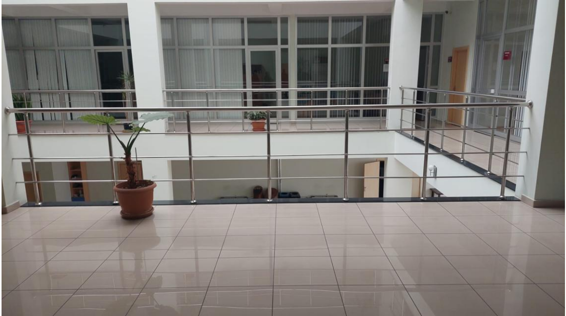
Şekil 3. Hukuk Fakültesi Saha Ziyareti

Üniversitemiz bünyesinde yer alan birimlerin iş güvenliği açısından fiziki durumlarını görmek ve risk değerlendirmesi çalışmaları için Şalpazarı MYO, Beşikdüzü MYO, Vakfıkebir MYO, Tonya MYO, Çarşıbaşı MYO, Hukuk Fakültesi ve İlahiyat Fakültesi ziyaret edilerek durumları gözlemlendi Saha ziyaretleri ile ilgili görseller Şekil 3, Şekil 4 ve Şekil 5'te gösterilmiştir.