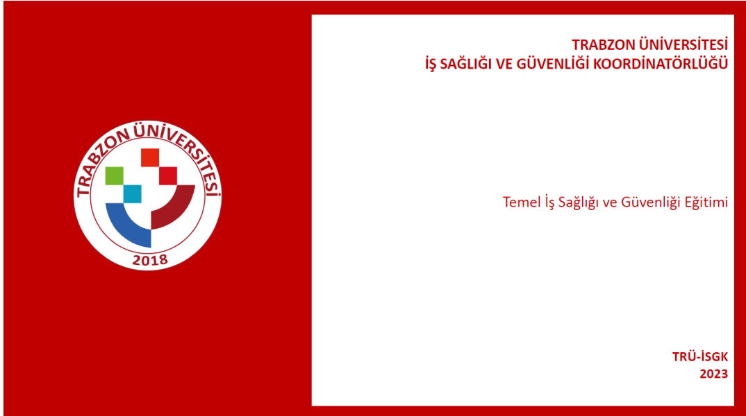
Şekil 9. Temel İSG Eğitimi

Çalışanların İş Sağlığı ve Güvenliği Eğitimlerinin Usul ve esasları Hakkında Yönetmelik kapsamında Trabzon Üniversitesi personelinin alması gereken Temel İş sağlığı ve Güvenliği için eğitim videoları hazırlama süreci tamamlamıştır.