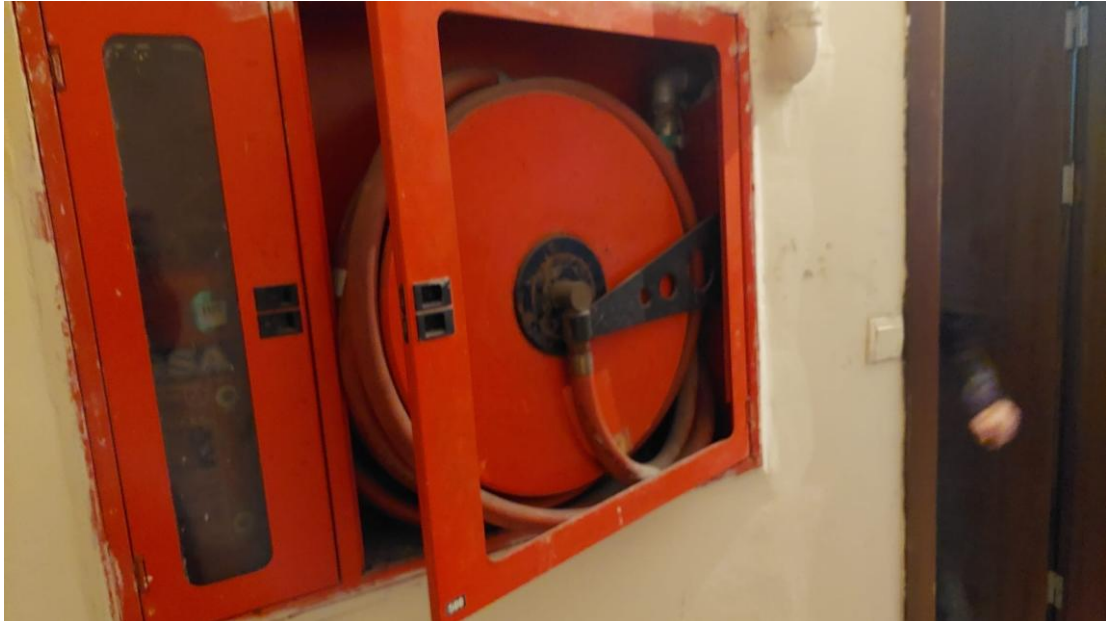
Şekil 5. Vakfıkebir MYO Saha Ziyareti