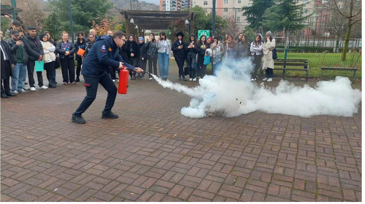
Şekil 8. Yangın Tatbikatı