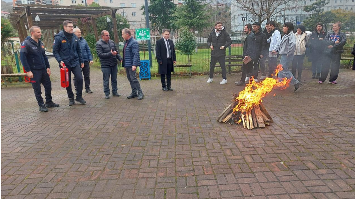
Şekil 7. Yangın Tatbikatı

Beşikdüzü Meslek Yüksek Okulu Büro Yönetimi ve Yönetici Asistanlığı Programı öğrencilerinin Gönüllülük Çalışmaları dersi kapsamında Beşikdüzü İtfaiyesi Grup Amirliği ile organize edilen Yangın ve Afet Bilinci konulu Tatbikat ve Konferans Etkinliği gerçekleştirildi. Tatbikata koordinatörlük olarak iştirak ettik ve yapılması gerekenler ile ilgili bilgi alışverişi yapıldı. Etkinlik ile ilgili görsel Şekil 5'te paylaşılmıştır.