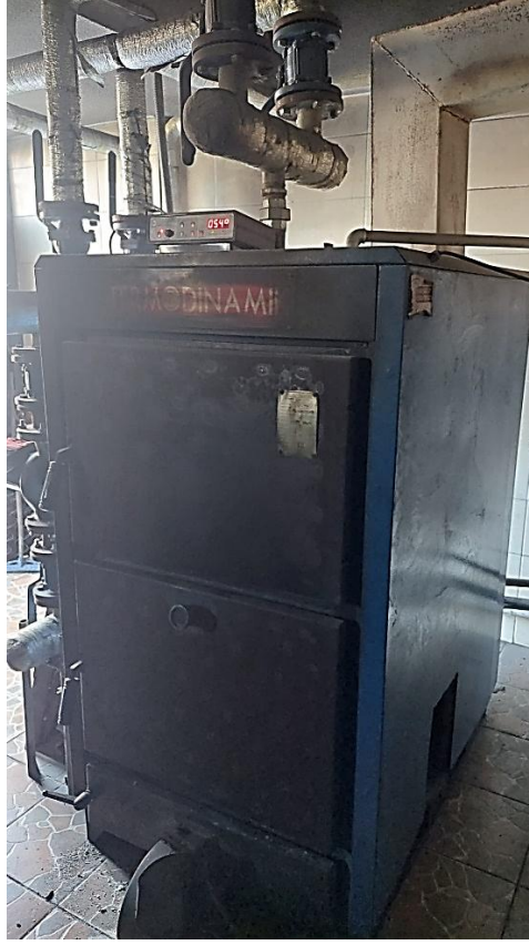
Şekil 4. Şalpazarı MYO Saha Ziyareti